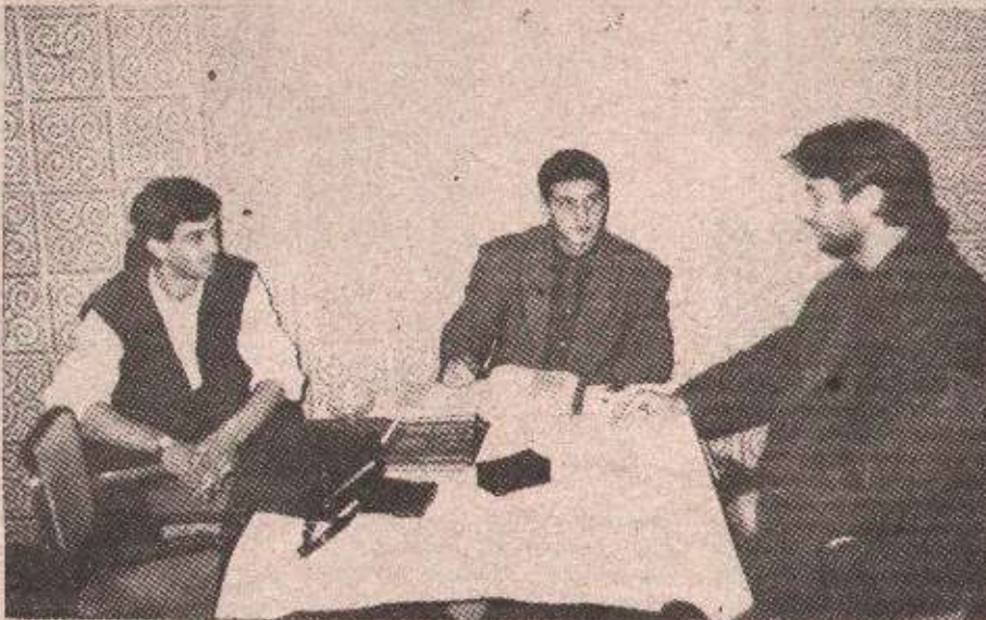
На налози привредних достигнућа западних српских земаља у Београду Детаљ са штампала „Универзала“

Према том уговору, радници бањолучког „Универзала“ ће у наредна два месеца у Земун испоручити хидрауличке инсталације за једноредне бераче кукуруза у вредности од 200 хиљада марака.