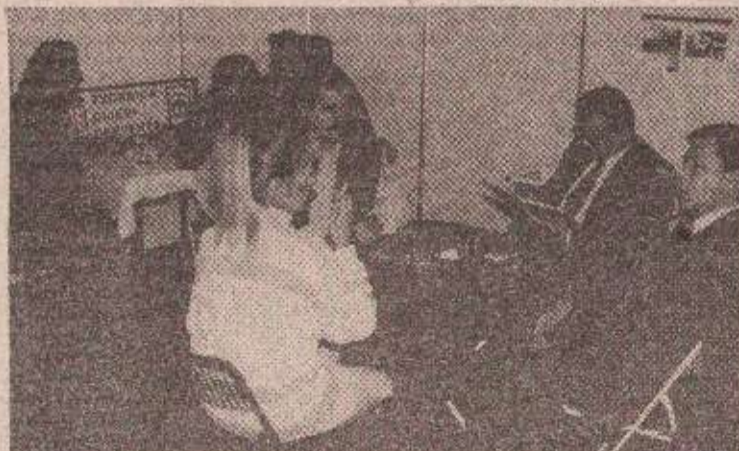
Бројни пословни контакти гаранција успешности

пречника од четири до 100 милиметара које се користе у многим грамама индустрије. Тако нудимо цеви малих мера, цеви опште намене, цеви за амортизере, жарене цеви, хидро испитаче цевовске цеви. Према томе ди-