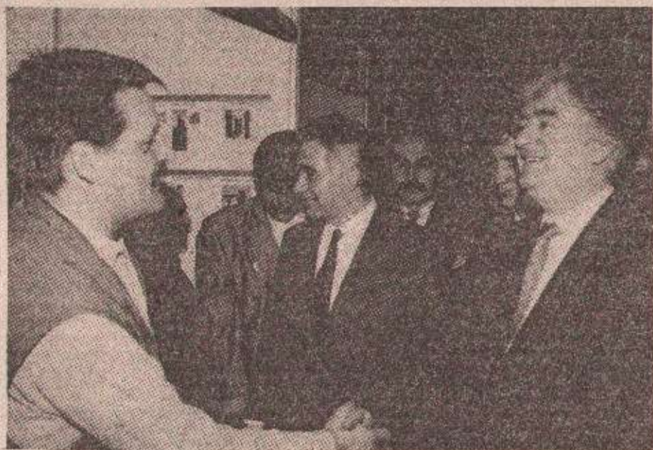
Делегација Републике Српске посетила изложбу привредних достигнућа у Београду (детал са штанда УНИС из Дервенте)