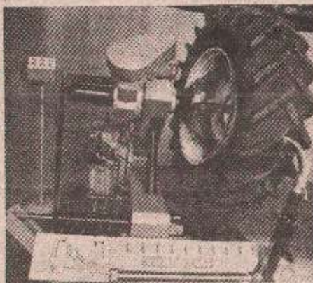
ремени-дела шестора „Универзала“

санкција, све фирме су спремне да врло брзо нормализују производњу. Што се тиче конкретних договора, ми из „Универзала“ смо имали разговоре преко пословне контакте са УНИСОМ са Илице, што је од великог финансијског, комерцијалног па и политичког значаја јер док заиста не буду сарађивали сви наши региони и градови у Републици Српској то јединство ће временом да излази без обзира што се ради о једном народу и јединственој држави. На овој изложби ми смо још више продубили традиционално добре односе са многим трговинским кућама из Југославије. У „Прогресу“ из Београда смо разговарали о могућностима наплаћивања наших потраживања из Ирака вредности више од 200 хиљада марака која су стара већ пет - шест година. Такође смо разговарали и о још неким пословима не само за „Универзал“ него и за