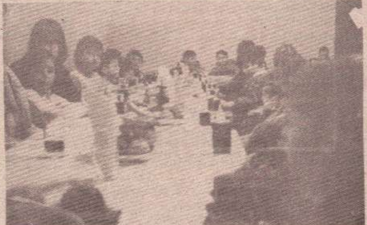
У ОЧЕКИВАЊУ ПИЈУКАЊА: Деца су се сладкила воћем