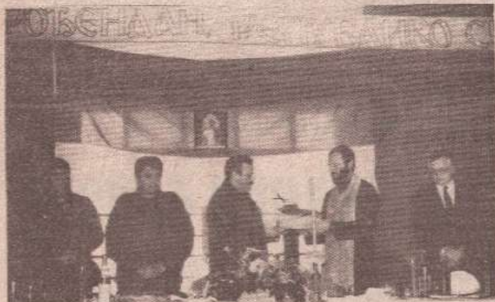
Свечани тренутак на прослави у Станарима

СТАНАРИ, 10. јануара - Јуче, на Дан Републике Српске, борци и официри Шеснаесте крајишке моторизоване бригаде уприличили су у ресторану Рудника Станари свечаност којој су