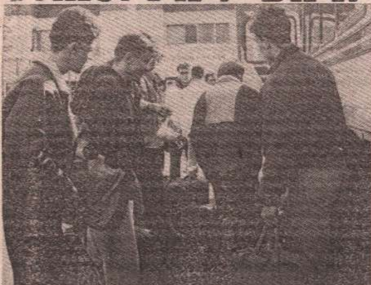
ПУТ У НЕИЗВЕСТНОСТ: Фудбалери Борца пред полазак у Бач и Лесковац