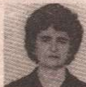
БОСЕ МИРЈАНИН РОЂЕНЕ РАЧИП

У среду 13.1.1994. године навршава се 6 месеци од смрти наше драге сестре, заове и тетке