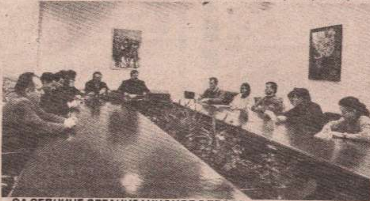
СА СЕДНИЦЕ ОРГАНИЗАЦИОНОГ ОДБОРА

Спонзори ове манифестације за ову прилику су обезбедили и вредне награде. Тако ће „Амбалажерка“ из Трна наградити најбољег голмана, „Тропик“ из Бање Луке, најбољу играчицу а