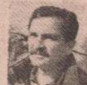
СЛОБОДАНА БОБАНА КУСТУРИЋА