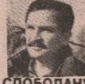
СЛОБОДАНУ БОБАНУ КУСТУРИЋУ