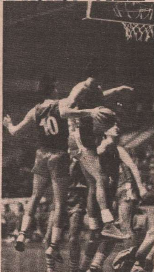
Кошарка се враћа у бањолучки „Борик“

ЗБОГ НЕДОЛИЧНОГ ПОНАШАЊА НАВИЈАЧА И ТРЕНЕРА