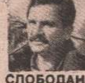
СЛОБОДАНА БОБАНА КУСТУРИЋА