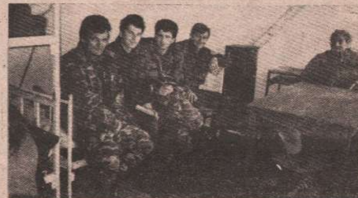
Српска и хрватска полиција на српском пункту у Челебићу

Када је већ пао мрак, кренули смо у Међугорје. У хотелу „Ана-Мари“, до готово самог јутра, дуги разговори о свему и свачему. Обиље информација које намеравам да објавим у серији текстова у наредним бројевима „Гласа српског“. Информације које су потпуно нове и које се нису могле наслутити, али које наводе на помисао да је рат између Хрвата и Срба, бар на овом подручју, готов.