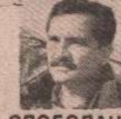
СЛОБОДАНА КУСТУ КУСТУРИЋА