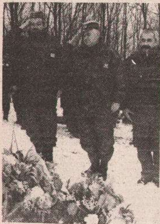
Почасна стража генерал-потпуковника Момира Талића са сарадницима

ПРЊАВОР 14. фебруара — Поводом годишњице јуначке смрти легендарног команданта