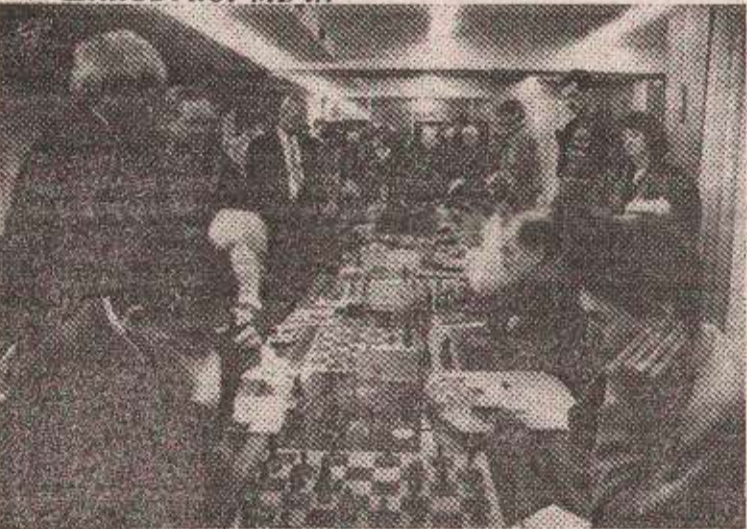
БЕЛНИКО ИНТЕРЕСОВАЊЕ: Меч је проматрапо доста публике

НАКОН ОДРЖАНОГ ПРИЈАТЕЉСКОГ ШАХОВСКОГ МЕЧА