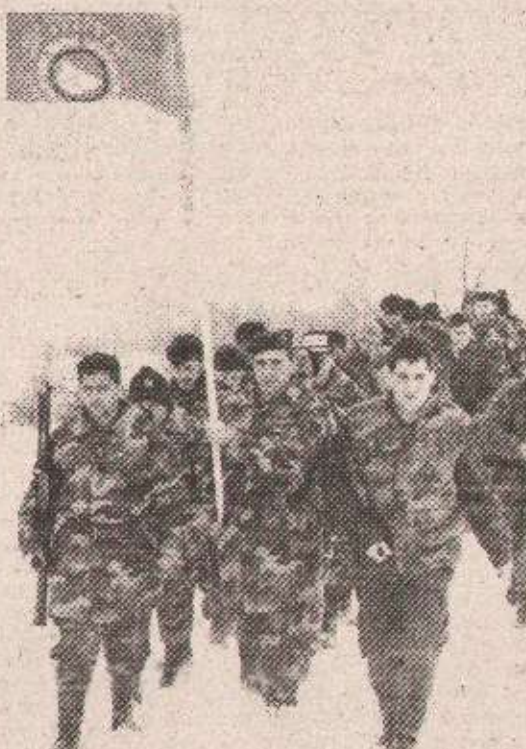
„Вукови са Вучјака“ Почасни строј

ПРЊАВОР 14. фебруара — Поводом годишњице јуначке смрти легендарног команданта