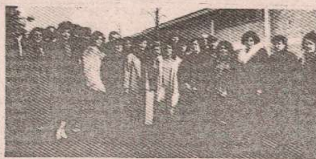
Редовни даваоци крви: радници „Инцела“