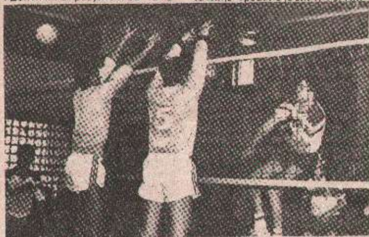
МОМЕНАТ СА УТАКМИЦЕ МОДРИЧА — МАЈЕВИЦА

Трећи сет је почео у знаку Авијатичара који је водио са 7:0 и 10:30 запријетиши на тај начин гостима. Плод такве игре чијесу коцке игре чврсто држали Бањолучани, јесте и резултат од 15:8. У четвртном сету Модричани „допазе себи“ и поново се на терену води изједначена борба да би на крају ипак спавили домаћи одбојкаши резултатом 15:10. У петом одлучујућем сету десило се „чудо кевићево“. Од самог почетка авијатичари су имали надмоћ, па отуда вођства од 9:3 и 13:9. И онда, када су