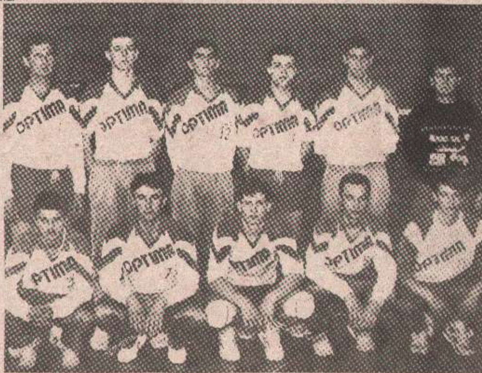
ФИНАЛИСТИ - На турниру који је одржан у дворани „Мејдан“ четири екипе су се бориле за прво мјесто, односно за улазак у финале Купа Републике Српске за одбојкаше. Састав Модрича-Оптиме (на слици), уз бањолучани Врбас, ускоро ће се борити за трофеј који се додјељује освајачу КУПА.