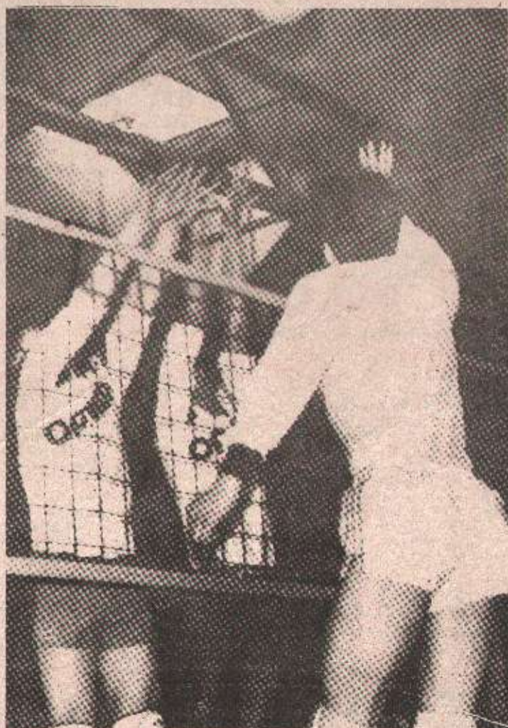
ДУЕЛ — Битка у „Мејдану“ била је лијепа, бескомпромисна. Најзбуђњани дуел био је онај између састава Модрича-Оптиме и Авнјатичара. Побједа је, послније пет сетова, припала момцима из „града одбојке“.