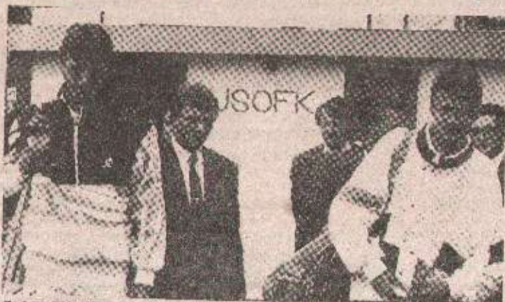
Бојан ВУЈИЋ: Све ближе и Горану Иванкишевићу, бившем југословенском репрезентативцу

ловенски шампион је био видно депримиран. Спортски је, ипак, честитао противнику, а онда истакао: - Тра-