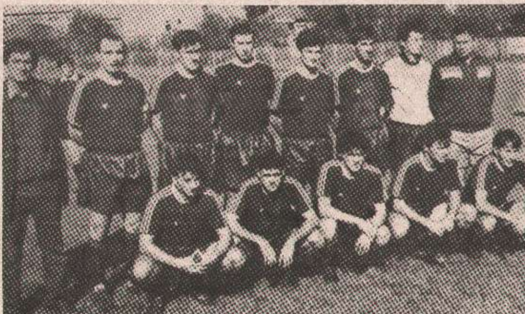
ГЛАСИНАЦ ВЕЋ У МИСЛИМА: Екипа бањолучког БСК—а

— Сви су задовољни. Ипак, ако неко посебно треба истаћи, онда је то прије свих Турудија. Играо је оди-