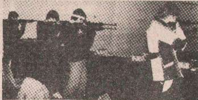
НАДМЕТАЊЕ: Изрешетане мете

На првенству млађих категорија доминирали стријелци из Бање Луке. Такмичење сениора и сениорки завршено јуче касној послерије подне