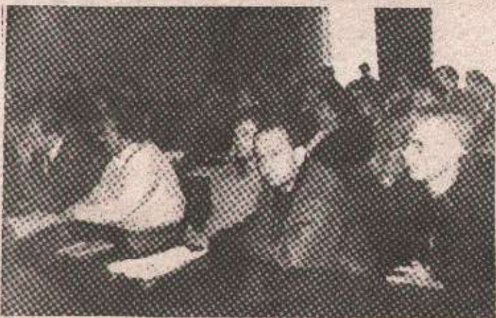
Закључак Скупштине: хитна категоризација учесника рата