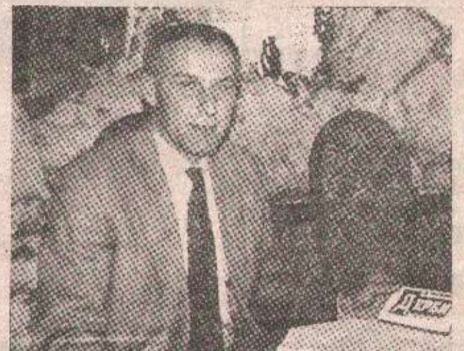
Цијлићева добродошлица за „Дерби“

У завршној фази је склапање уговора са спонзорима, зах-