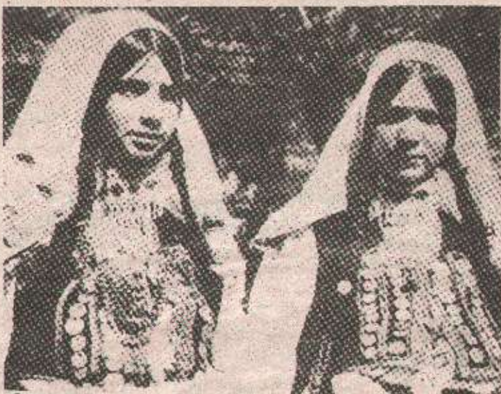
Захваљујући фолклору сачувало се и благо народних ношњи

Турнеју по Србији завршили су у Буковцу код Новог Сада у коме углавном живе досељеници из Крајине. У свим срединама гдје су гостовали градишки филклористи, музичари, изворне групе и извођачи народних pjesама