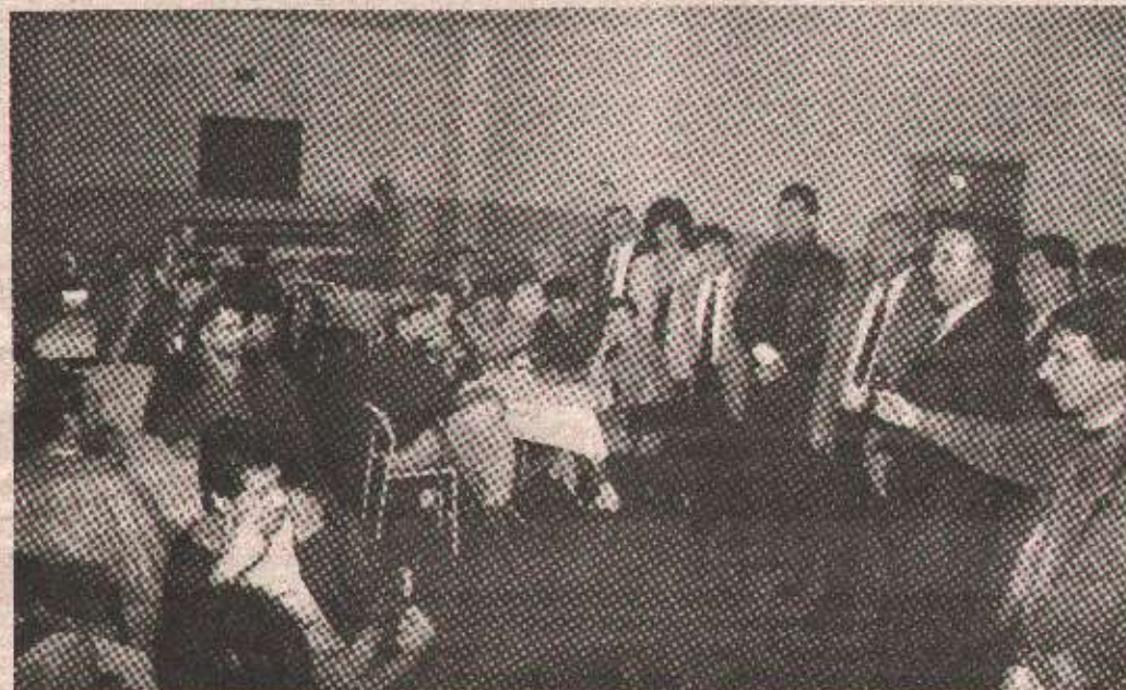
Представници Странке српског јединства у посети пацијентима Завода „Др Мирослав Зотовић“

Осим избора руководства чланови Странке српског јединства из обје српске државе, објавили су декларацију поводом потписивања хрватско-муслиманског споразума, у којој се између осталог каже: „Не можемо дозволити да наше српско име буде затрто, да српски народ буде избрисан из историје, да наше српске земље буду прецртане из географских карата. Стога тражимо од највиших народних