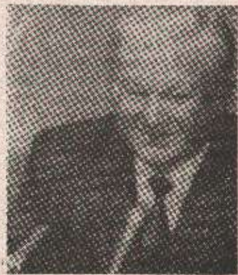
Борис Јељцин — неко жели дестабилизацију Русије

Сва председник Борис Јељцин окарактерисао је информације о наводном погоршању његовог здравственог стања и гласине о припремању државног удара као покушај да се „вјештачки дестабилизује ситуација у Русији“. Председник је послје повратка из Сочија у Москву изјавио да постоје људи који по сваку цијену желе да га смјене, служећи се лажима и другим нечасним средствима.