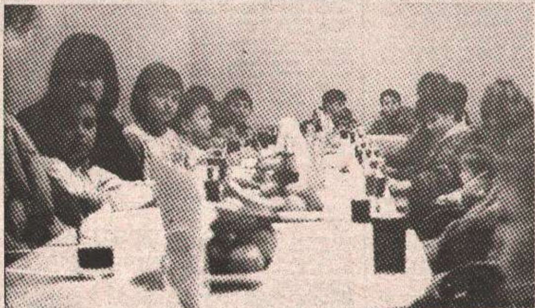
Обвезница зајма - поклони дјеци палих бораца

На овом састанку Председништва у проширеном саставу