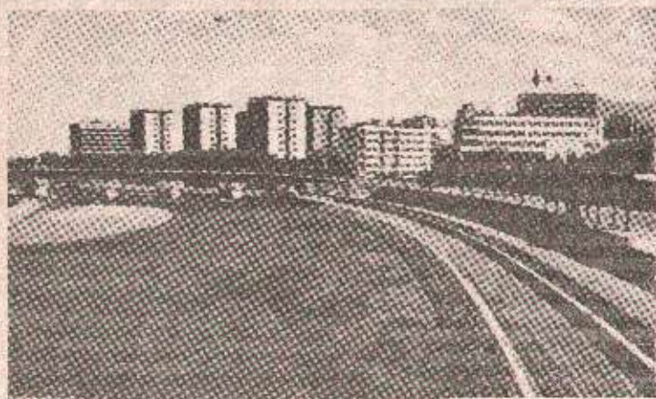
Скопје - завршавања послова турске империје

● Министарство за рад и социјалну политику Македоније донијело одлуку и одобрило отварање дјечијих вртића на турском језику за малишане исламизираних Македонаца у Дебру и Жупи дебарској гдје уопште нема етничких турака