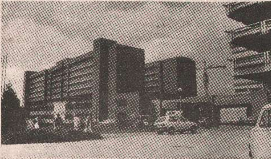
Коме су отворена врата болнице - Болница у Бањој Луци

земљорадника. Уколико не дођу до средстава на тај начин, онда ће морати из свог буџета покривати здравствене услуге својих домова здравља.