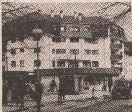
Из центра Кључа

Кључ, 31. марта — У Кључу се са посебним интересовањем, али не и с претјераним оптимизмом, очекује 20. засједање Општинске скупштине. Оно би, како је најављено, требало да се одржи у понедељак, 4. априла. Кажемо требало јер, ако је судити по досадашњим искуствима, није искључено да се помјери, као и обично, на неодрожено вријеме