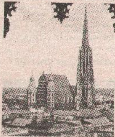
БЕЧ - повољна разговора на загребачки споразум

БЕЧ, 31. марта (Танјуг) - Споразум о прекиду ватре, који су у сриједу у Загребу потписали представници Републике Српске Крајине и Хрватске, поздрављен је у