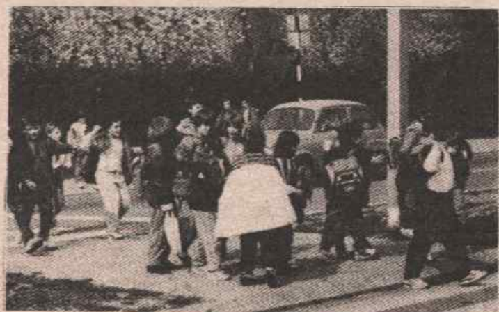
У школском дворишту, чекајући наставника

По свему судећи, у бањолучким основним школама све зависи од снажљивости директора: како пронаћи предаваче за наставу од петог до осмог разреда, односно обезбиједити квалификациону структуру по закону