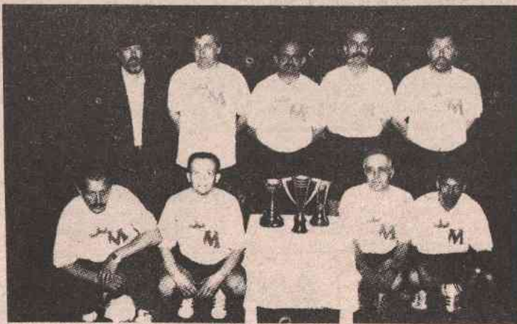
ОД ЈЕСЕНИ У ПРВОЈ ЛИГИ ЈУГОСЛАВИЈЕ: Куглаши ПАРТИЗАНА

Освајањем првог мјеста, у што нимало не траба сумњати. Партизан би се од јесени такмичио у Првој савезној лиги Југославије, гдје ће, надамо се, постизати запажене резултате. Највећи конкурент за прво мјесто, Боксит, на овом турниру заузео је тек треће мјесто и тако вјероватно изгубио трку за титулу. На трећу позицију изабро је Рудар, остваривши други резултат турнира и сакупивши 32 бода, колико има и „Чајавец“, па тако ова два клуба дијеле треће и четврто мјесто. На петој позицији налази се Витаминка, потврђујући тако примат