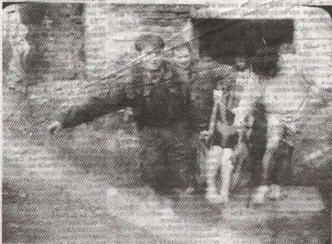
Спавање умрелих у Брчком