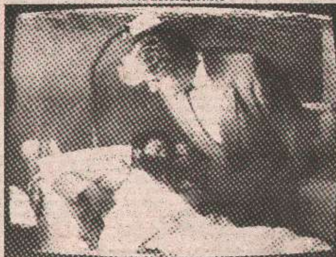
Председник Републике Српске у обиласку рањених цивила у брчанској болници