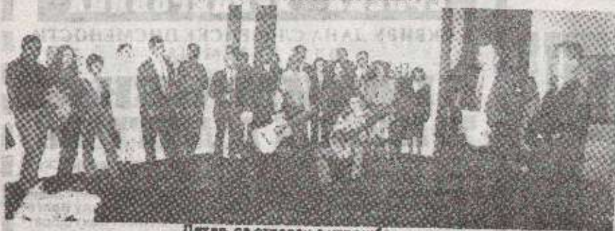
Детаљ са отварања изложбе

ПРЕКСИНОМ У БАЊОЛУЧКОЈ ГАЛЕРИЈИ ОТВОРЕНА „ПРОЛЕЃНА ИЗЛОЖБА '94“