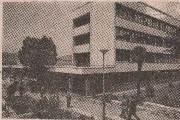
ХОТЕЛ „ТРЕБИШНИЦА“ у Билећи

ГРАДИШКА 17. маја - На подручју градишке општине досада је уписано више од 700 хиљада динара зајма за одбрану Републике Српске. Део зајма уписан је у роби, али има значајних износних и у новцу. Примера ради ДИП „Подградњак“ уписали су у готовини зајам у износу од 110 хиљада динара. Према постојећој евиденцији највећи зајам, у износу од 250 хиљада динара уписао је ПД „Младен Стојановић“ из Нове Тополе. Спорије ДИП „Радник“ са стотину хиљада „Лазаре“ са 70 и „Велетрговина“ са 33 хиљаде динара. „Метал“ је уписао више од 30 хиљада „33 Градишка“ 28 „Стандард“ око 23 и „Поткозарје“ више од 15 хиљада динара. Према својим могућностима у одређеним износима зајам су уписали и 33 „Ливне“ из Рогова, Пријатно предузеће „Омега промет“, „Инжењеринг“, „15. Јануар, те Миловац Бурсаљ, земљорадник из Сефаросаца и други. Иначе, евиденција о уписаним зајмима још није савршена па се може очекивати да ће се савршни износ знатно увећати. Г. Ш.