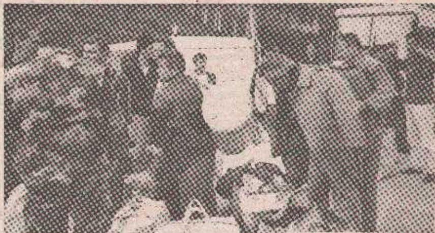
Након двогодишњег тавновања напокон на слободи: Затвореници зеничког КП дома