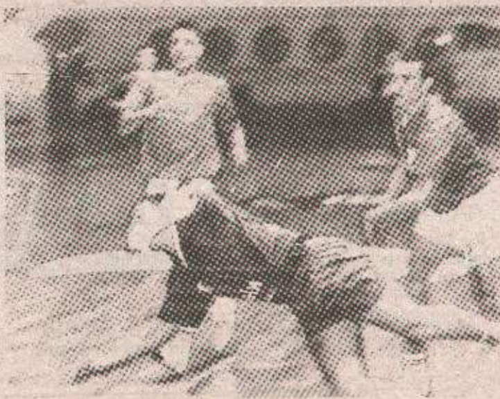
Дерби Борца и Приједора: нова узбуђења у „Борнику“

Борац-Крајс ће наступити у комплетном саставу. У екипи ће се послије дужег