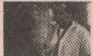
Џек Николсон и Кетлин Тарнер

- Новости 15.40 - Музички албум 16.00 - Директна линија 18.05 - За вашу душу 19.00 - Вечерњи дневник 19.40 - Музички предах 20.00 - Вечерњи програм 22.00 - Вечерње новости 22.30 - Ревизијски оркестри 23.05 - ЕКГ 00.00 - Преглед дана 00.10 - Ноћни програм са вјестима у 1.00, 2.00, 3.00 и 4.00