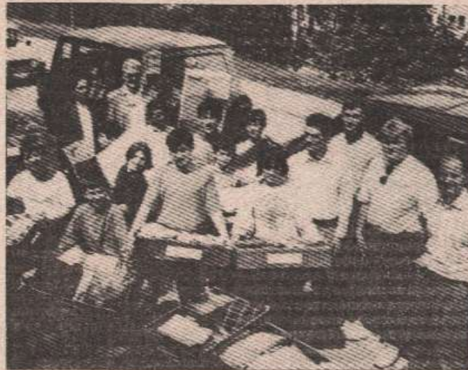
Дјеца дома нису заборављена