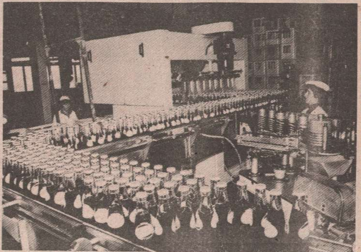
„Пуним погоном“ у погону за производњу воћних напитака и газираних пића

А данашња производна оријентација „ФРУКТОНЕ“ се темељи на сировинској бази која