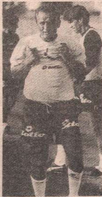
СТВОРИТИ ТИМ ЗА ПОБЈЕДУ: ЉУПКО ПЕТРОВИЋ

Пред канцеларијом шефа Стручног штаба и директора Црвене звезде стоји сваки дан по неколико фудбалера. Стари првотимци би у печалбу, а други би да их замјене на њиховим мјестима. Наравно, Петровић и Џајић се договарају, комбинују, како би Црвена звезда била увијек оно што и јесте.