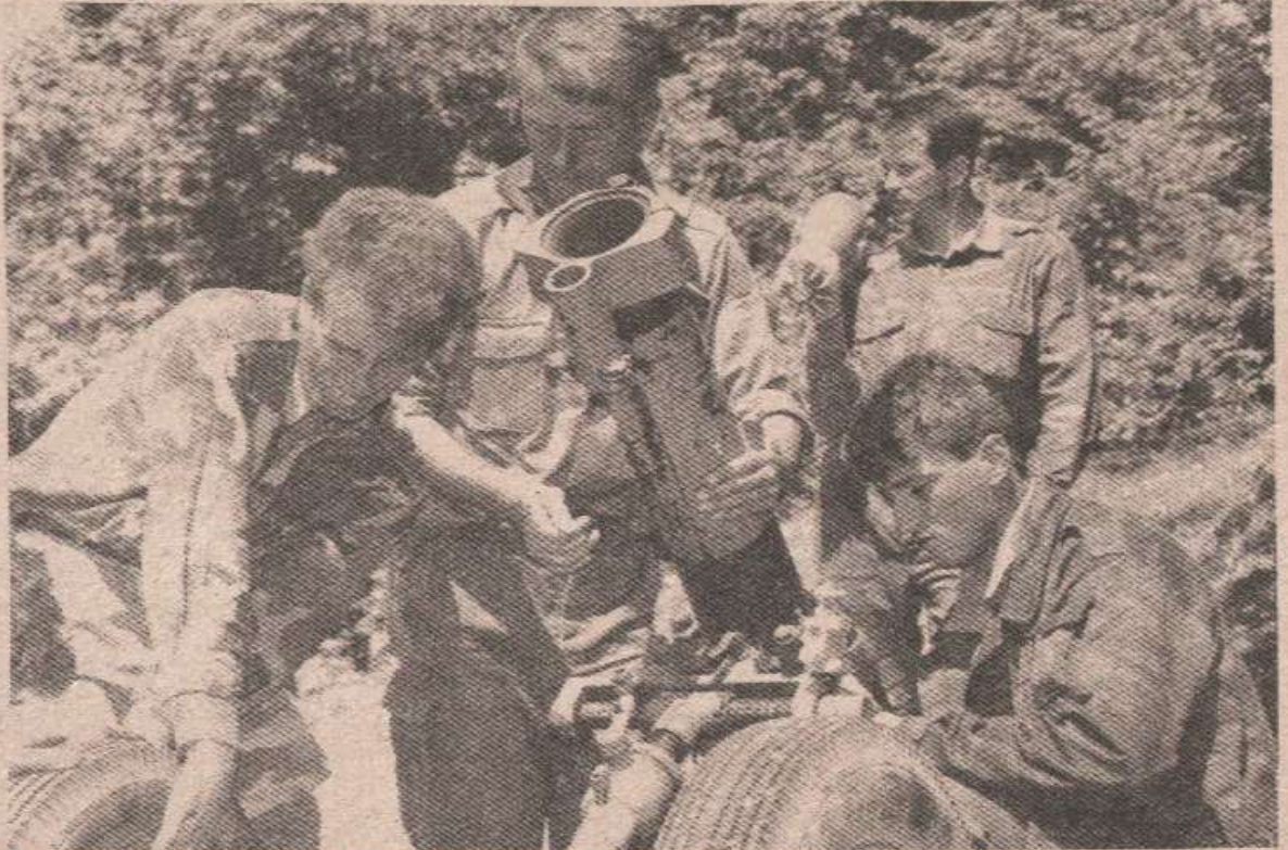
Сваки покрет муслимана који бјеже из долине пакла српски артиљеријци будно прате и дејствују

Иначе, у протеклих осам дана на обронцима Влашића и Комара, или боље речено на влашићком и србобранском ратишту, протутњала је још једна муслиманска офанзива. Борци Републике Српске су алаховим ратницима одржали такву