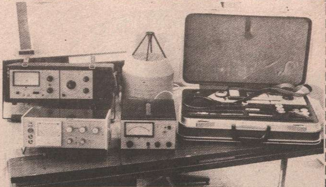
Савремена опрема за мјерење буке и вибрације свакодневно је „у рукама“ стручњака Института.

ва при чему нећемо запоставити дугогодишњу веома успјешну сарадњу ни са сличним институцијама у Београду, Новом Саду, Нишу, Подгорици, те централним институтима у Будимпешти, Варшави и Софији. Такође због потреба, желимо нашу дјелатност проширити на истраживање и заштиту у области рударства, што пред овај колектив ставља изузетно сложене и тешке задатке од чијег ће стручног извршења у многоме зависити савремена организација привређивања и живота уопште.