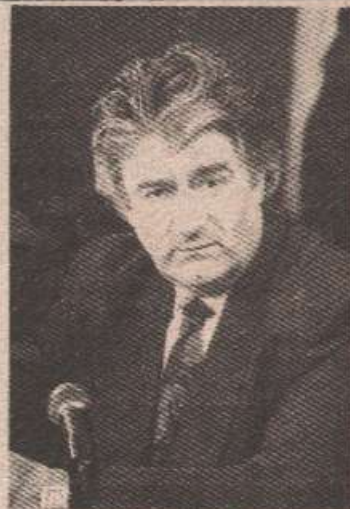
Радован Караџић: Српска страна опет није третирана равноправно

У завршници, вјероватно под притиском одређених фактора, који се нису легитимисали видно у Палати нација, Јасуши Акаши је извршио замјену платформи, мада је остављена могућност да се основа декларације контакт-групе разматра у некој другој прилици, наравно, под условом да муслимани заиста намјеравају да ика-