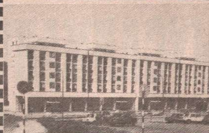
Стамбено-пословна зграда у Билећи