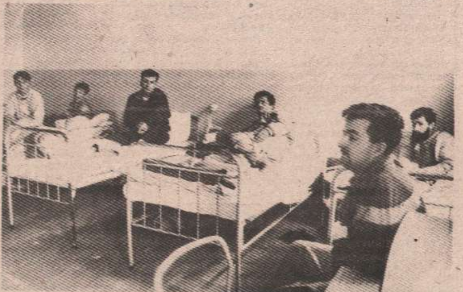
Беспарицу разумијемо, али... Рањеници из собе 213