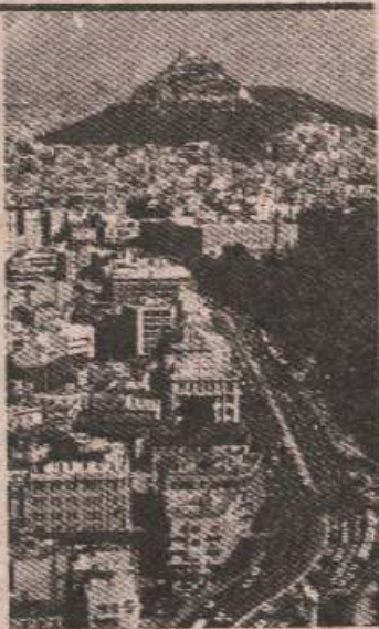
Атина: Турска демонстрира силу

Погоршање је дошло послје изјава турских званичника да ће Анкара као акт агресije схватити евентуални покушај Грчке да прошири своје територијалне воде у Егеју са садашњих шест на