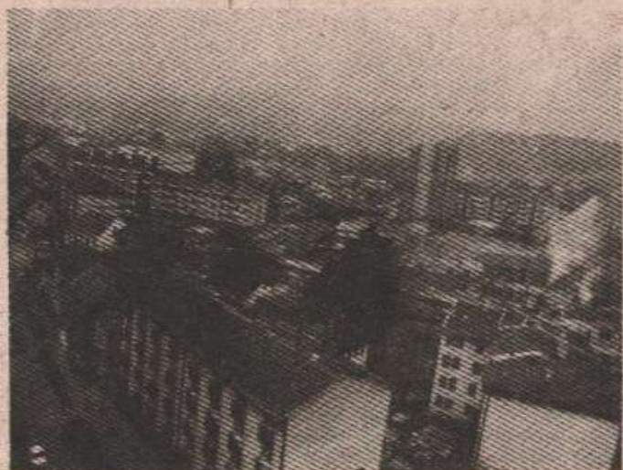
Панорама Новог Града