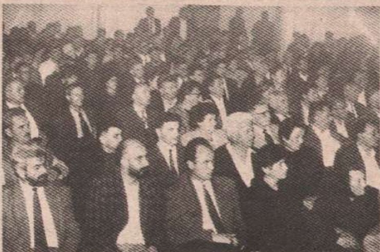
Прва у низу трибина под називом ТЕМЕ ВРЕМЕНА окупиле је велики број Бањолучана у великој сали Банског двора

— Не могу да кажем шта је био званичан став, а шта не када је у питању тај план. Сигурно знам оно што су изјавили. Верујем да су и тада зва-