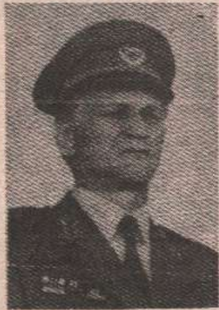
Момчило Перишић: Спремни за одаравање било каквог агресора

БЕОГРАД, 14. јуна (Танјуг) - Поводом дана Војске Југославије, начелник Генералштаба генерал-пуковник Момчило Перишић и министар одбране Павле Булатовић, са сарадницима, примили су данас иностране војне изасланике акредитоване у Савезној Републици Југославији.