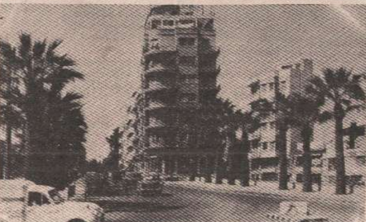
Никозија - тридесет година турске инвазије

У другој фази плана УН било је предвиђено стварање федерације