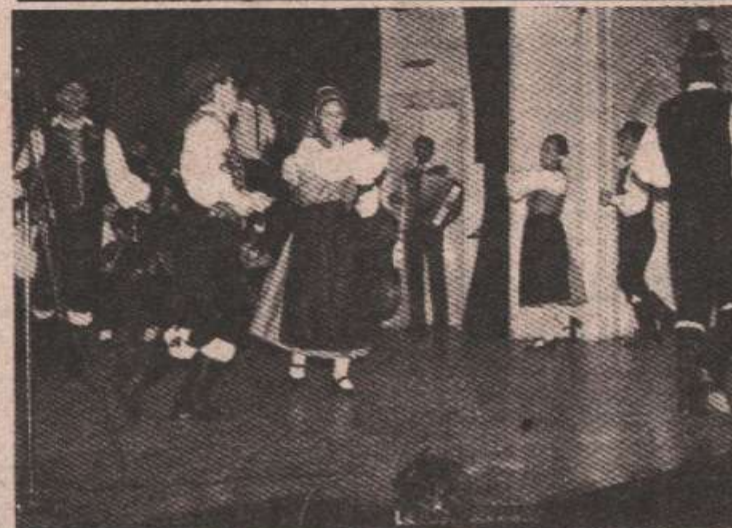
Фолклорни ансамбл „Маслеша“ учествоваће на „Сабору традиције и културе Срба“

Током љетних мјесеци „Маслеша“ ће да гостује на више значајних фолклорних манифестација широм српских земаља