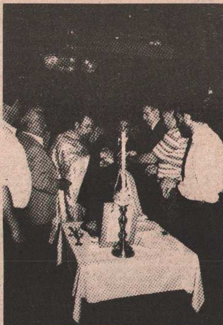
Помлађе славског кољача