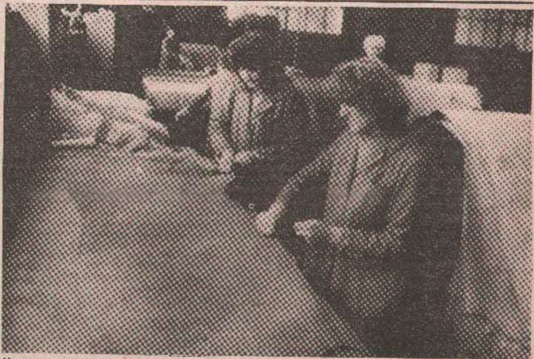
Из производних погона Фабрике коже „Лауш“

Данашња фабрика се налази на истој локацији гдје је започела прије скоро шездесет година. Савремени погони су изграђени послје катастрофалног земљотреса и представљају последњу ријеч технологије у преради коже, о чему своју оцјену најбоље могу дати наши стални пословни партнери — творнице обуће и кожне одјеће у мирнодопском времену оvdје је прерађивано дневно 18 тона сирове коже у двије хиљаде квалитетног ко-