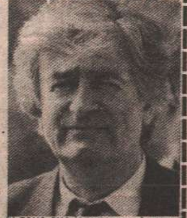
(у томе смо јединствени) да се ријеши питање Сарајева излаза на море. Ако се то ријеши, онда ћемо ријешити и питање даљег разграничења“, изјавио је Караџић „Политици“.

Нове мапе о подјели бивше Босне и Херцеговине, које је предложила контакт-група, опасније су од Венс-Овеновог плана јер се од Републике Српске тражи да се одрекне 13 градова за које су пали многи српски мпа-