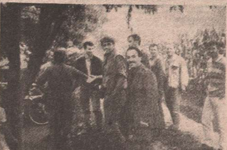
Тренуци одмора и сусрета с најближима — борци карановачке чете

Карановачка чета је упркос „времешности“ (просјек старости бораца је 44 године), све досадашње борбене задатке изшавала онако како доликује искусној ратној