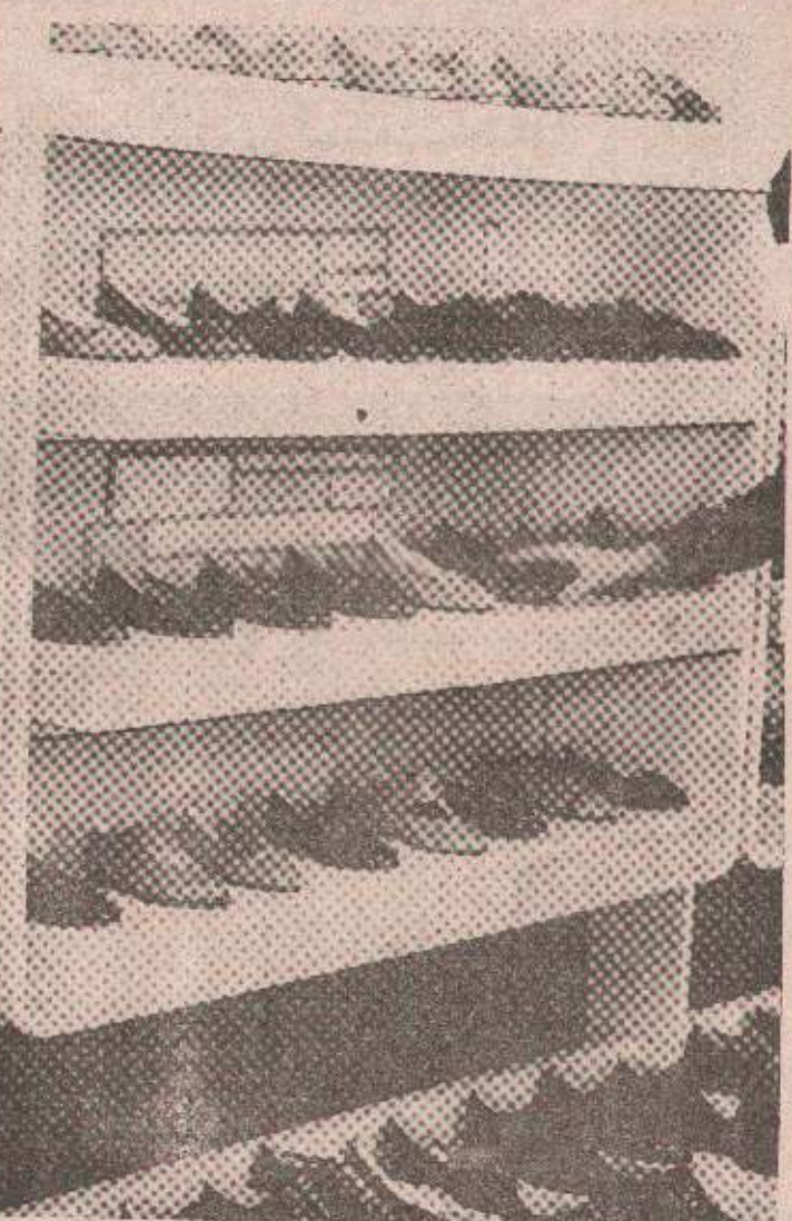
Финални производи од коже захтијевају квалитетну кожу.