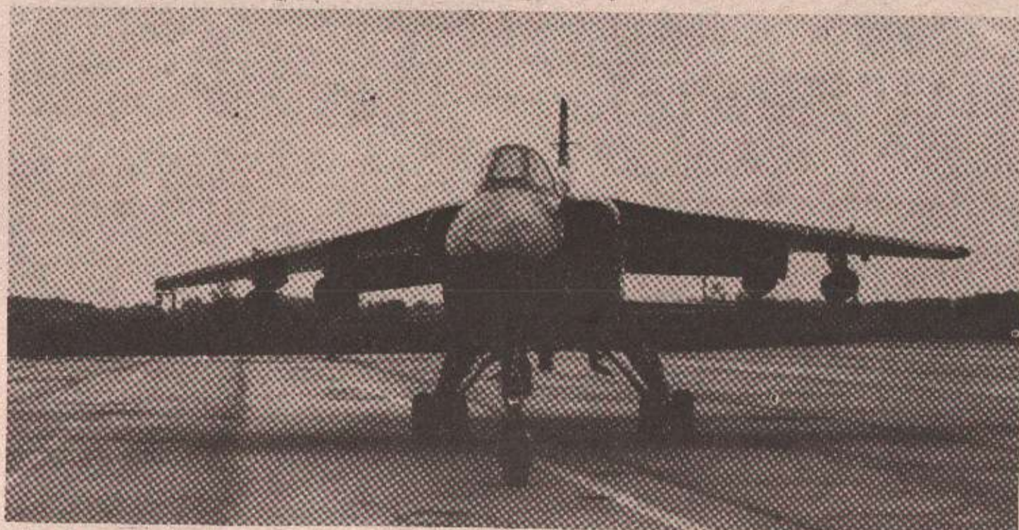
Моћни „Оро“ чека нови лет