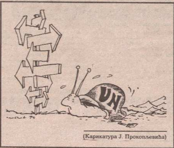
(Карикатура Ј. Прокопљевића)

„Елефтеротија“ каже да и неке западне земље, укључујући и један дио контакт-групе која кроји каплу за бившу Босну, изражавају све гласније неслагање са учесталим приједлозима Вашингтона да се плавни шлемови замијене — НАТО-трупама.