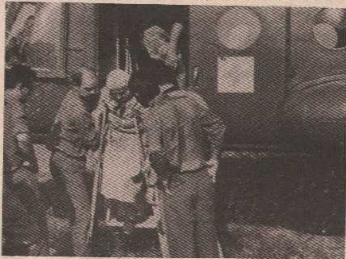
Ваздухопловци - хуманисти на дјелу

тати неподјељена, пилоти су схватили шта ће се, заправо, ускоро десити. Полетјели су свом народу и своју младост, знање и храброст ставили у његову службу. Нажалост, не сви. Ако. Они који су остали, доказали су да су кадри несребичношћу и при-