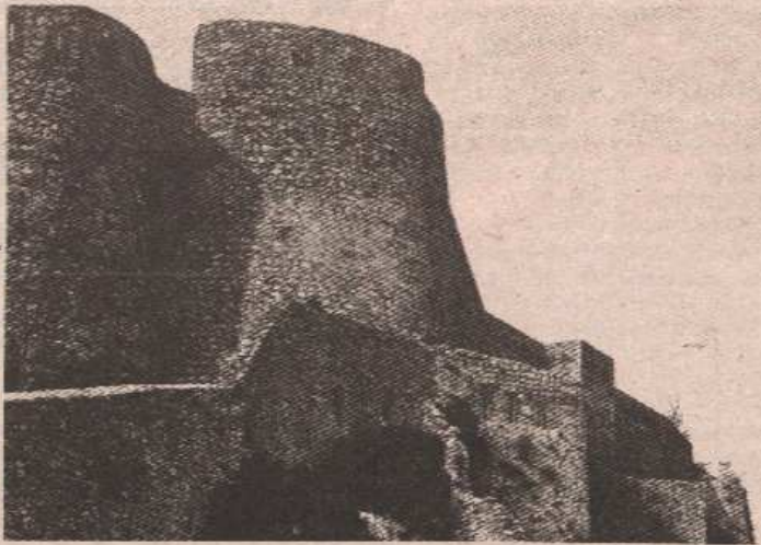
Све представе биће изведене на љетној позорници Книнске тврђаве