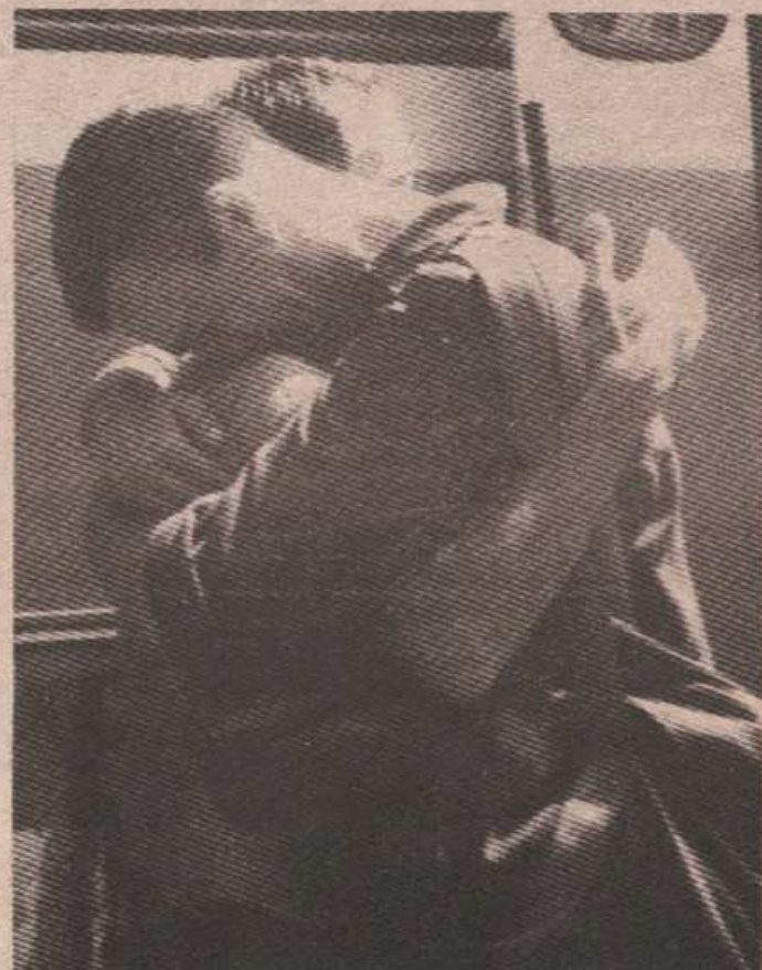
Отац и син након двије године поново скупа