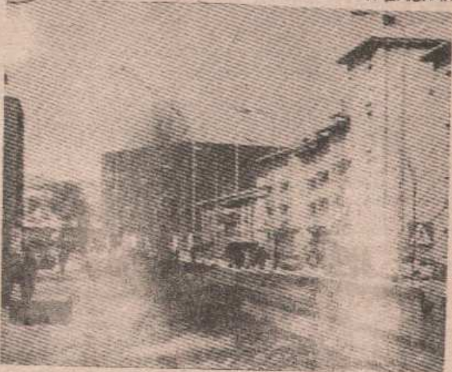
КРУПА НА УНИ