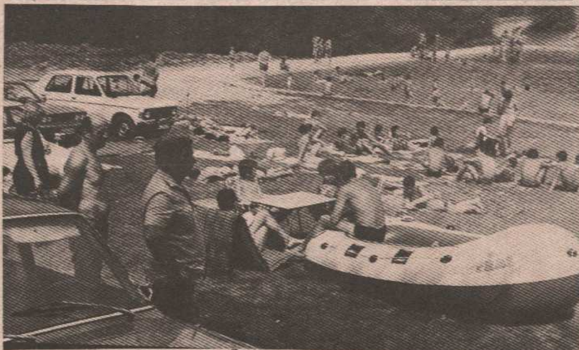
Љетни мотив са Балкана

● Предвиђено да се на језеру изгради скакаоница, чиме би се створили неки од предуслова за спортове на води