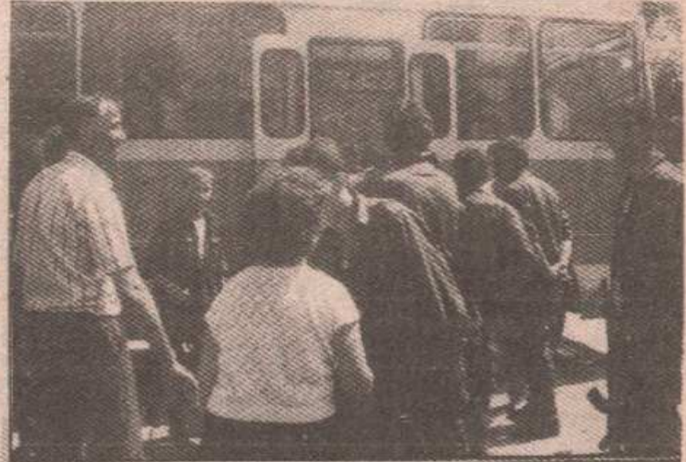
Србе из Травника дочекали су рођаци и пријатељи