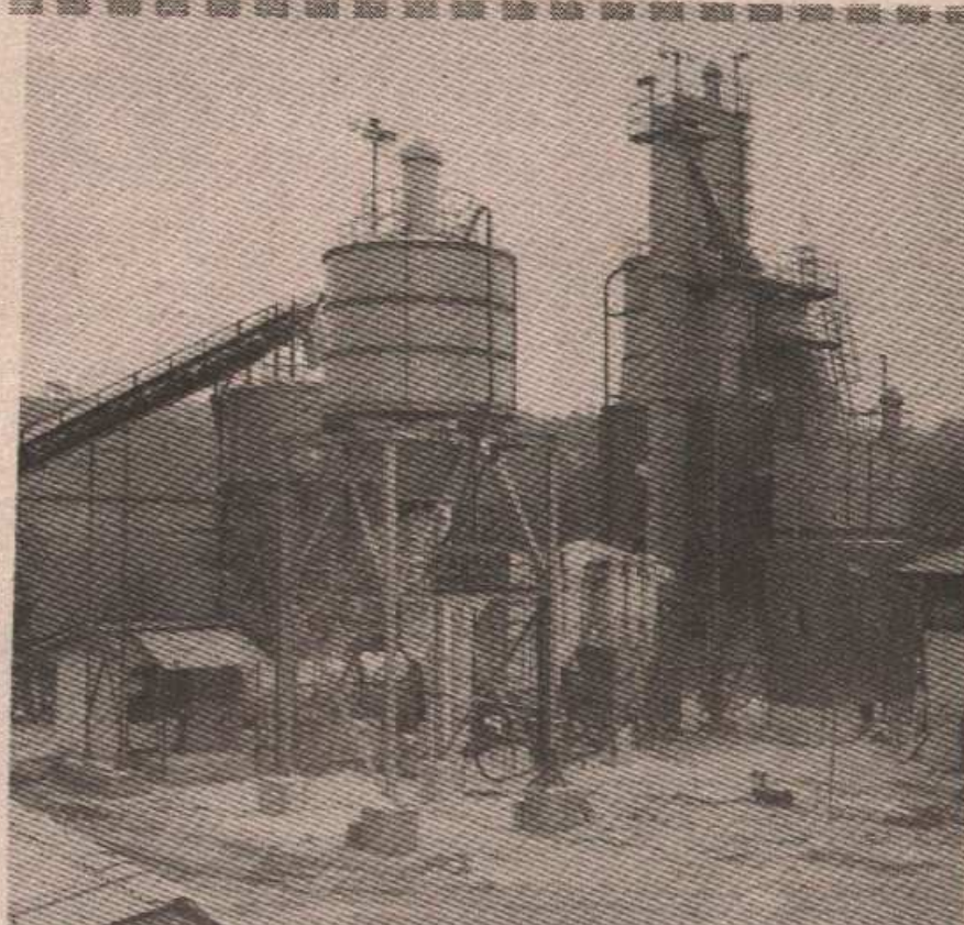
Савремени погон „МЕРМЕРА“ очувани и спреми за већу производњу

● Грађевинарство је област која у актуелном времену није довољно уполсена, што се најдиректније одразило и на пословање индустрије грађевинских материјала. ● И поред тога „МЕРМЕР“ из Челинца ради са 30. посто капацитета, захваљујући првенствено прилагођавању тржишту грађевинског материјала. ● Ускоро почиње рад још једна производна линија