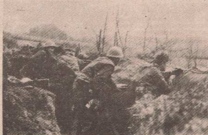
Стално на опрезу: Српски борци на србобранском ратишту

Претходни дан на бихаћком ратишту протекло је уз повремене снајперске провокације муслиманских јединица по српским линијама