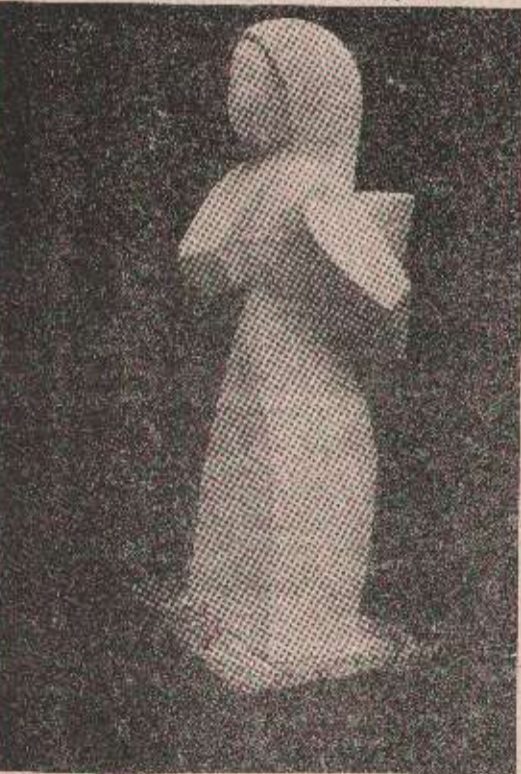
Асоцијативна скулптура - најзаступљенији стил

- Рађање ликовне колоније на Плитвицама омогућиће свим љубитељима ове врсте духовности да упознају и промикну у истинске дужовне вриједности које ликовна умјетност нуди. Поред тога, на овај начин желимо да на једном мјесту окупимо што више ликовних стваралаца са наших простора, што ће допринијети још квалитетнијем њиховом усавршавању, како ликовних техника, тако и властитих умјетничких израза. Уз то, наша намера је да сва манифестација постане традиционална и свесрпска - рекао је господин Пурлић.