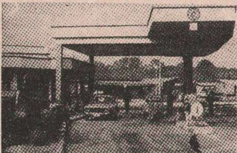
Пумпа у Борку

На овим првим пумпама кажу да су у току преговори око изнајмања неких могућности за набавку горива. Службеници „Енергопетрола“ отишли су у Савезну Републику Југославију да „направе посао“, али се у скорашње вријеме не очекује да би гориво могло стићи.