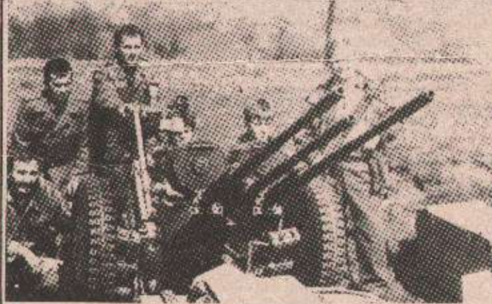
Спремни за рат и мир (архивски снимак)

● Балијске јединице извеле су јак артиљеријски напад у рејону Писаве Јелике , а затим и пјешадијски напад да пробију српске линије одбране у рејону Дебелог брда . ● На Озрену није било већих борбених дејстава осим на Возуђој . ● Дуж шпјеле линије раздвајања на влашкичком фронту балијске снаге су дејствовале стрелачким наоружањем. ● У рејону Крепшића хрватске снаге су из правца Вучилова испалиле више минобачачких пројектила по српским одбрамбеним линијама