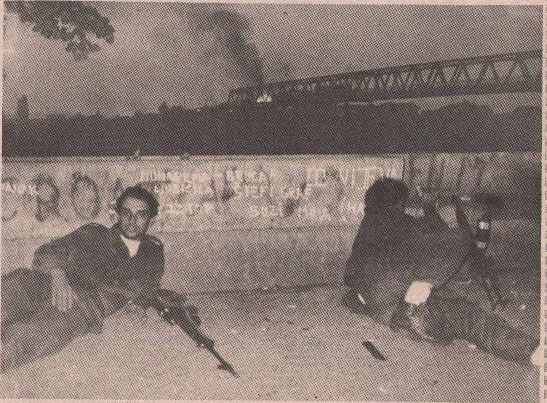
Српски борци пред мостом у Градишци 16. августа 1991. године увече

БАЊА ЛУКА, СРИЈЕДА, 17. АВГУСТ 1994. ГОДИНЕ • БРОЈ 7434, ГОДИНА LII • ПРИМЈЕРАК 50 НОВИХ ПАРА