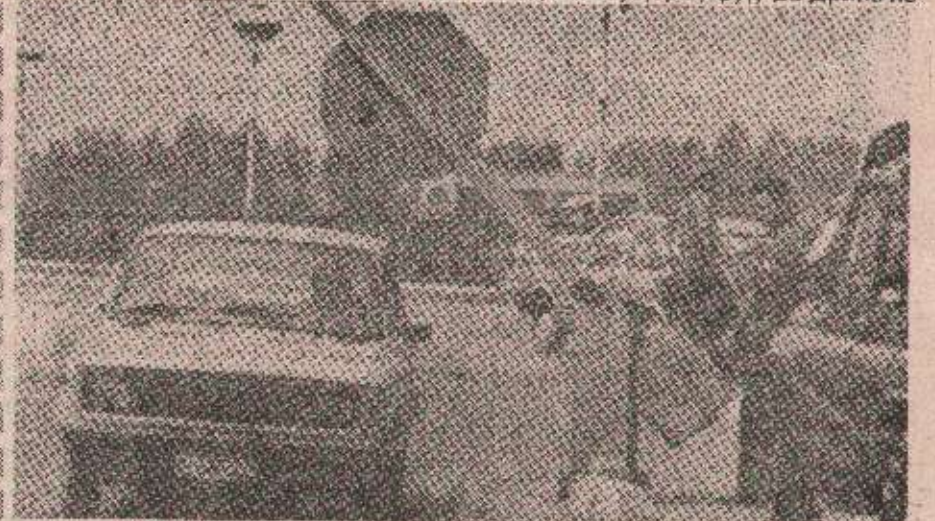
Путничка возила да, теретна не: Засреник ових дана

— Иако је југословенска граница на Дрини затворена већ пет дана, мисмо тек јуче из Србије успјели добити два шлепера с брашном. Данас или сутра