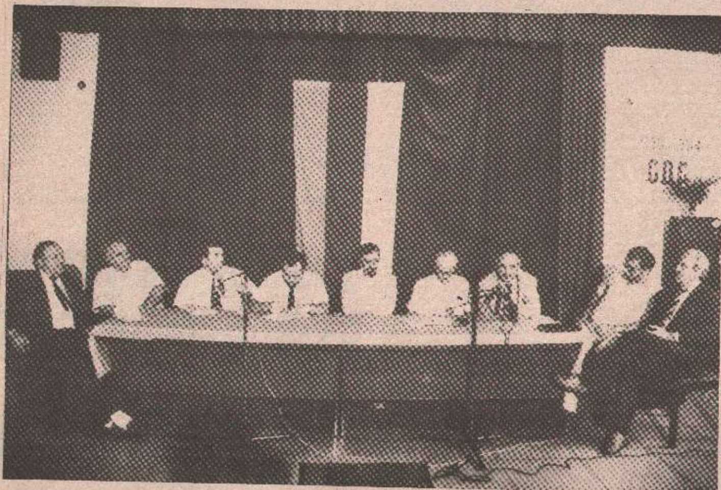
Учесници округлог стола у Санском Мосту

неко са стране помоћи да дођемо до мира. Нигдје се не каже да ће мир доћи ако се мале прихвати. Тачно је само то што пише у документу Козирјев је „западни“ човек, а западна елита влада у Русији. Они су једино били способни да уједине двије немачке, а да