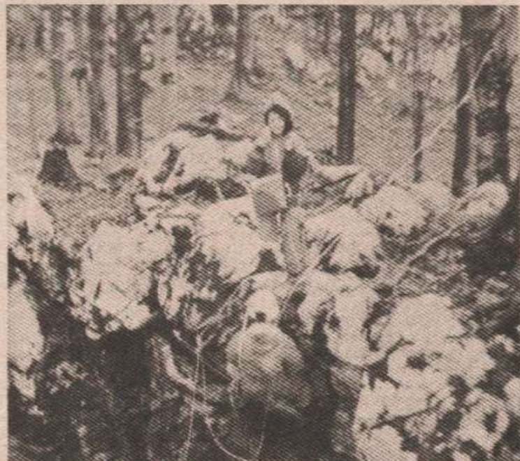
Нови изазов: бањолучки спелеолози на задатку