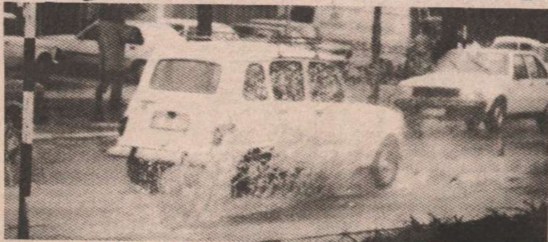
Освјежавајући талас брзо прошао градом

Велика киша која је јуче пала донијела је освјежење и пад температуре ваздуха. Јуче у 13 сати температура је износила 15 степени Целзијуса, што у односу на претходно мјерење и 22 степена Целзијуса значи знатно захлађење.