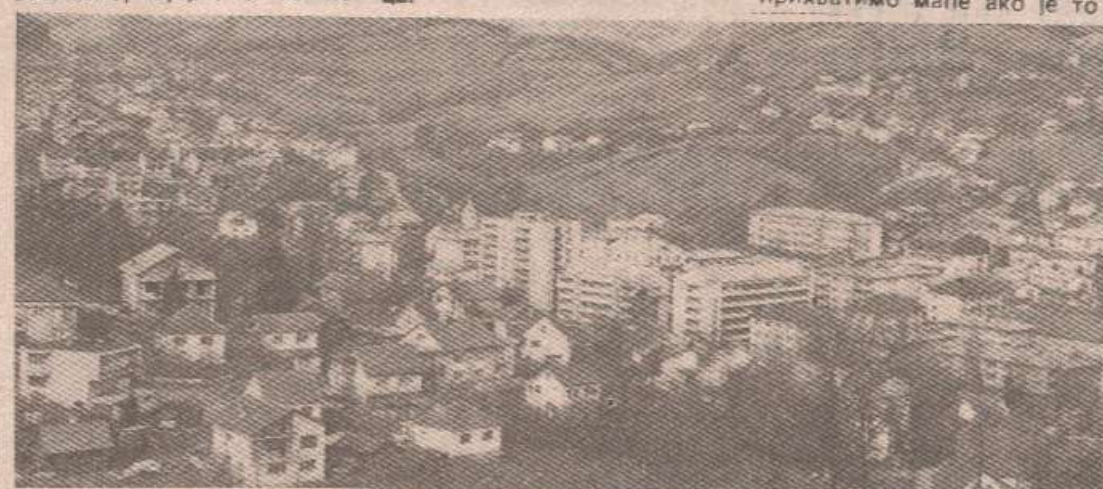
КЉУЧ — НИ САНКЦИЈЕ НАМ НЕ МОГУ НИШТА