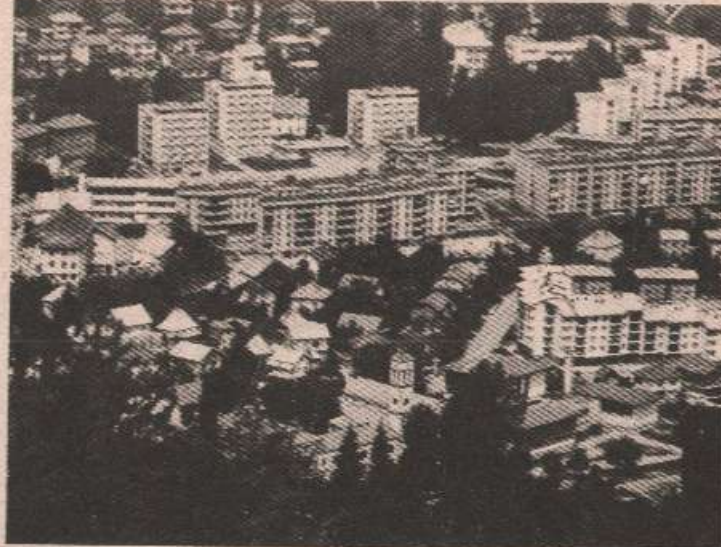
ЈАЈЦЕ — МИ ОСТАЈЕМО У РЕПУБЛИЦИ СРПСКОЈ

— У једну руку треба да прихватимо мапе ако је то