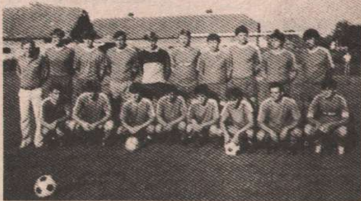
ОДЛУКА: фудбалери Колектива (Међаши)