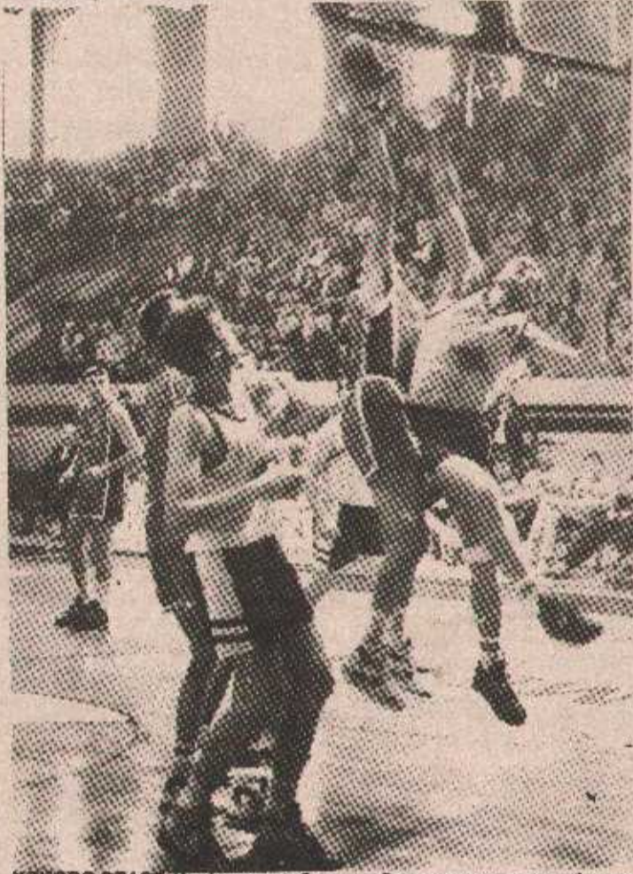
УСКОРО СТАРТ: Крајишки клубови имаће прилику да одиграју велики број званичних утакмица

С обзиром на то да је планиран почетак такмичења средином септембра клубовима је остављен рок да се до 31. августа пријаве и дефинитивно потврде учешће а