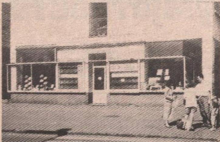
Књижара БИГ3-а - ђачка торба скупа

Почетак нове школске године означио је још једну бригу за родитеље - како обезбиједити све потребне уџбенике, свеске, прибор... Ратни услови и општа беспарица условили су да луксуз постане и оно што се мора набавити. Посебно је скупо школовање. Некад су дјеца тражила нове скупљене торбе, посебне оквири, перницу „коју нико нема“, а сад је велика ствар имати уџбенике са мирисом штампарије који нису ишарани и већ коришћени.