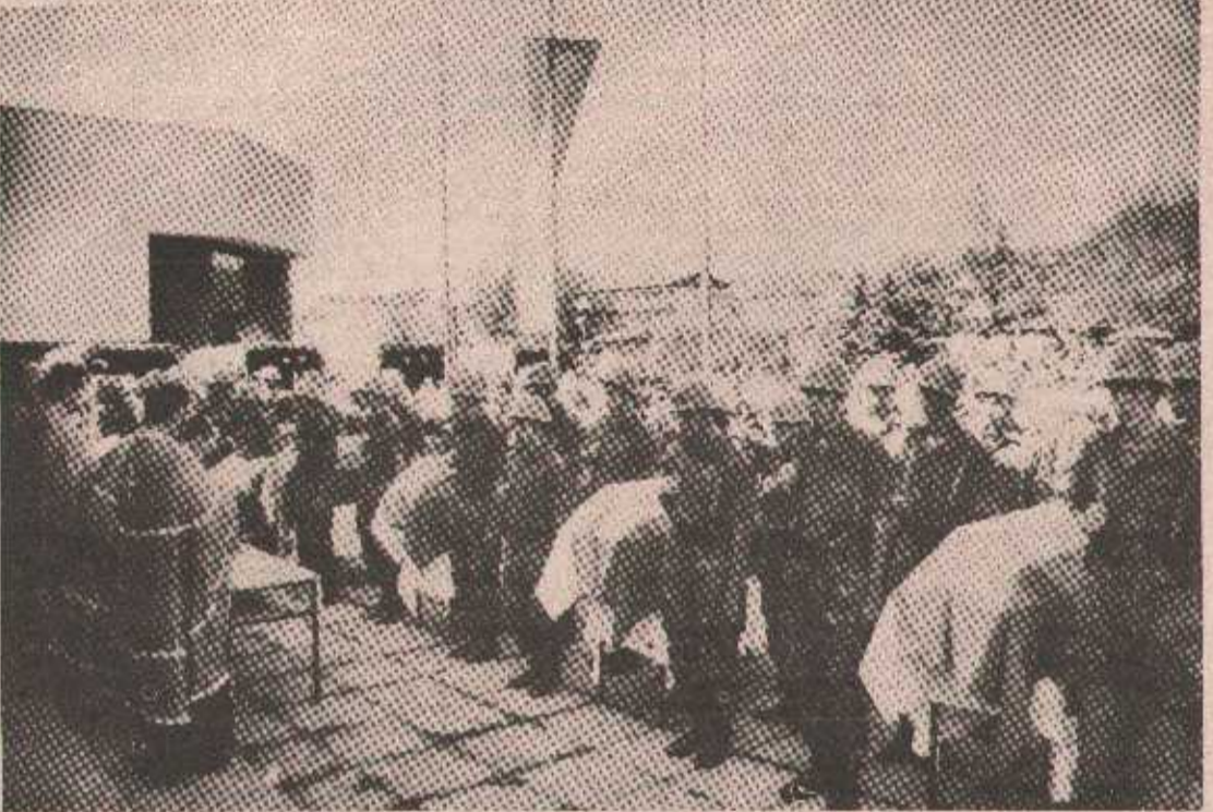
Тренутак опроштаја од сабораца

су вјековима гинуле на српској земљи за исту ствар за коју се и данас боримо: за своју земљу, за своју културу, за своју вјеру, за сретнији живот покољења која ће доћи... Тура је големи невоља пре-