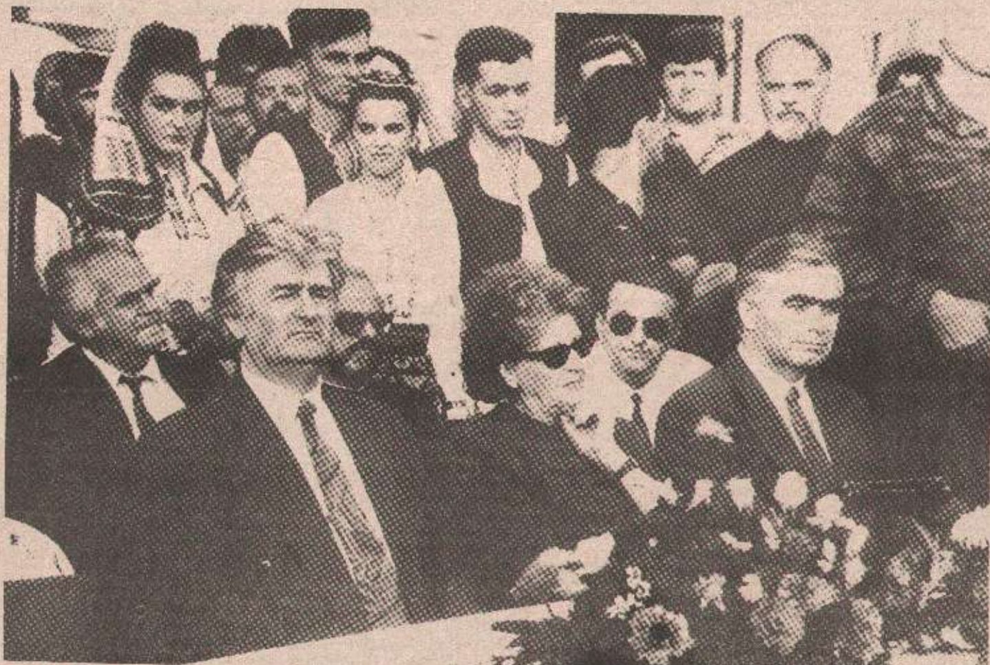
Нема вам је срећна и дуговека суверена и независна Република Српске, све до тренутка док се не ујединимо са другим српским државама - најљепша честитка народу председника др Радована Караџића

Велики митинг српске слоге, који је уприличен у недељу послје подне (21. августа) на Тргу Крајине у Бањој Луци остаће упамћен по много чему. Сазван уочи предстојећег референдума да слогом и одлучношћу српског народа, његовог државно-политичког руко-