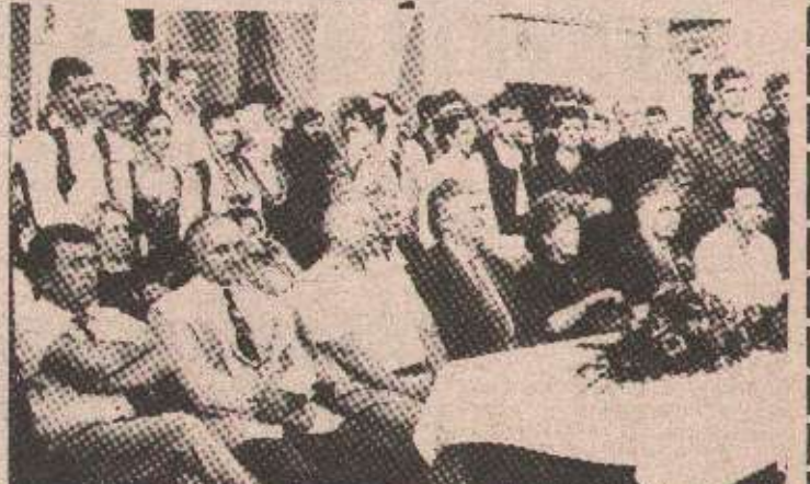
Увијек уз свој народ, и у најодсуднијем часу, упркос пријетњама и уцјенама - учесници великог митинга српске слоге.