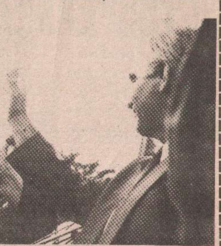
До виђења у јединственој српској држави!

више овај народ одлукама, закључцима, прогласима...“ Свеколику хипокризију бијелосјетских силника прозreo је и презreo мр Момчило Крајишник, председник Народне скупштине Републике Српске: „По њима су