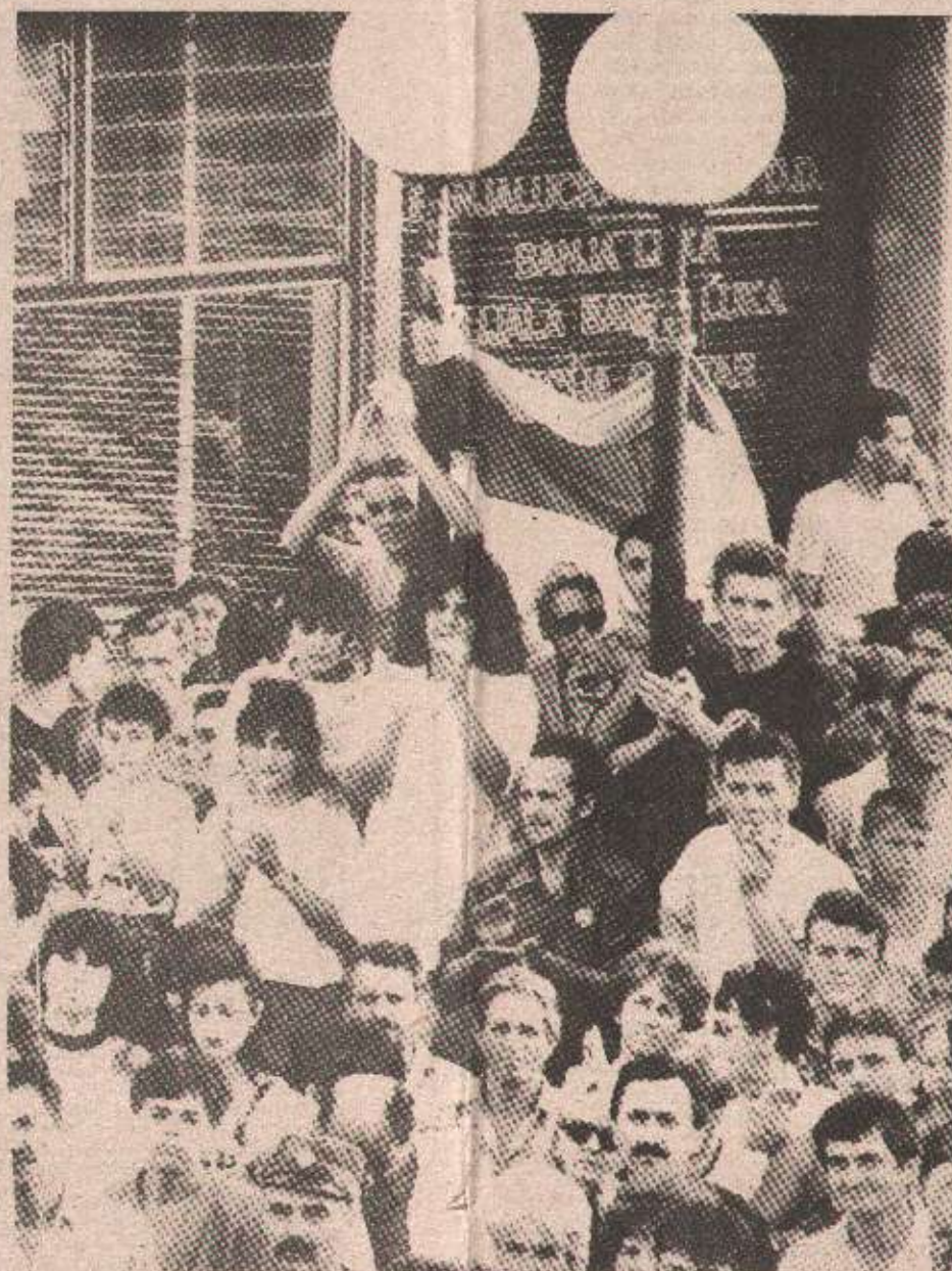
Народ ће на референдуму 27. и 28. августа потврдити легитимитет свог политичког и државног руководства.

водства и његове славне и храбре војске - одбаци капитулацију и понижење које натурају свјетски силници у виду тзв. мировног планова, митинг је био и својеврсно сабориште српског памћења и присјећања, рекапитулације српског страдања и узнесења од Косова до дана данашњих.