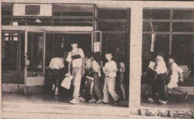
Први школски дан основца школе „Јован Цвијић“

Просвјетари су се забавили питањем набавке уџбеника. На примјер, у Основној школи „Јован Цвијић“ обезбиједили су уџбенике за све разреде, а родитељи ће их платити у три рате. Не треба наглашавати колико је то олакшање за родитеље, јер је породични буџет поодавно истрошен. Покушали су то и други са различитим успјехом.