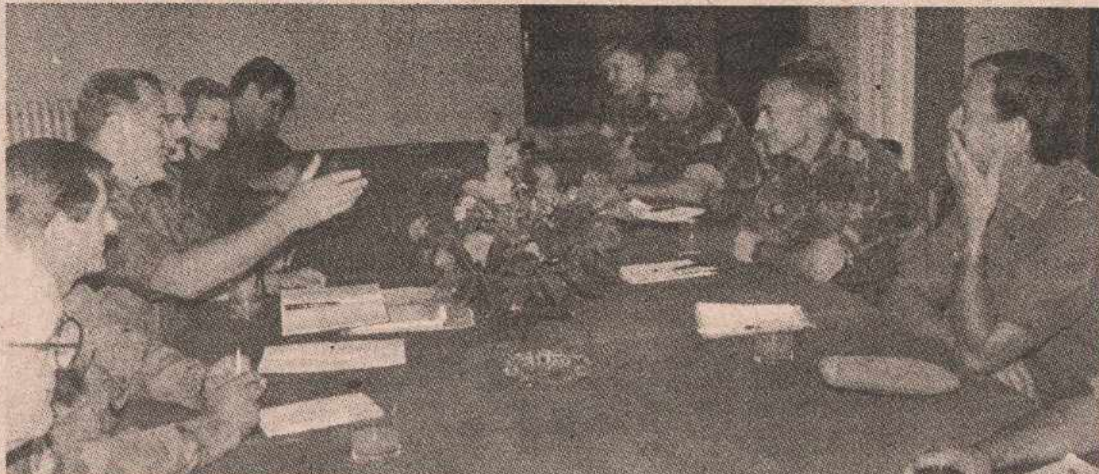
Са састанка генерала Младића са војном делегацијом САД и командантом УНПРОФОР-а за бившу БиХ у Бањој Луци

Генерал-потпуковник КЛАРК ВЕСТЛИ: „Као војници