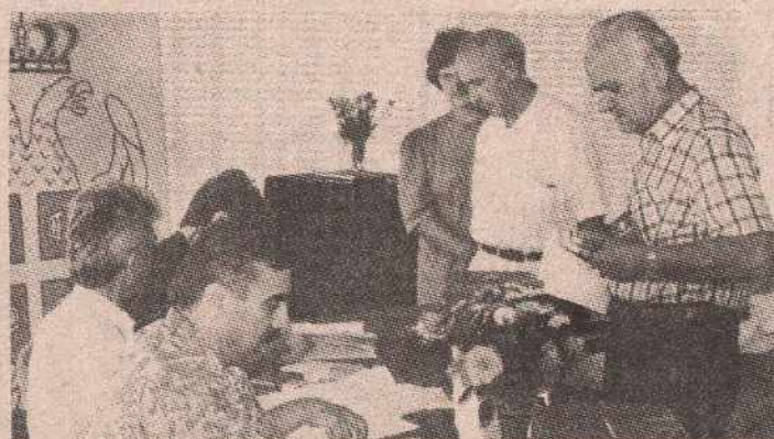
Без проблема: гласачко мјесто у Лакташима