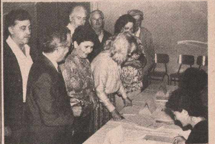
У јутарњим часовима већ је гласало двадесет одсто бирача

Мјесна заједница Центар 1 обухвата три гласачка мјеста. Уписано је 4508 гласача, а гласање је почело на вријеме.