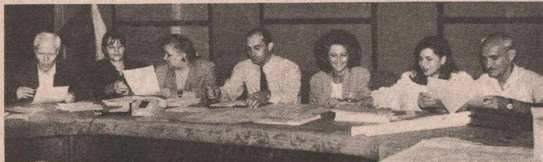
Централна општинска комисија - пуне руке посла

БАЊА ЛУКА, 27. августа - Од 57 мјесних заједница на подручју бањолучке општине, односно 110 гласачких мјеста, до 15 часова у централну општинску комисију за спровођење референдума стигли су подаци о резултатима гласања за само 14 мјесних заједница. Најбољи одзив гласача забиљежен је у мјесним заједницама Лавш, Лазарево 1, 2 и 4 и Обилићево 1, 2 и 3, кажу у општинској комисији.