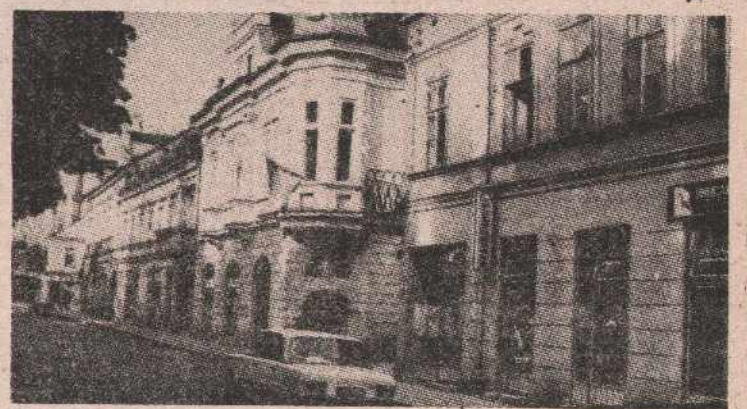
Улица у Приједору