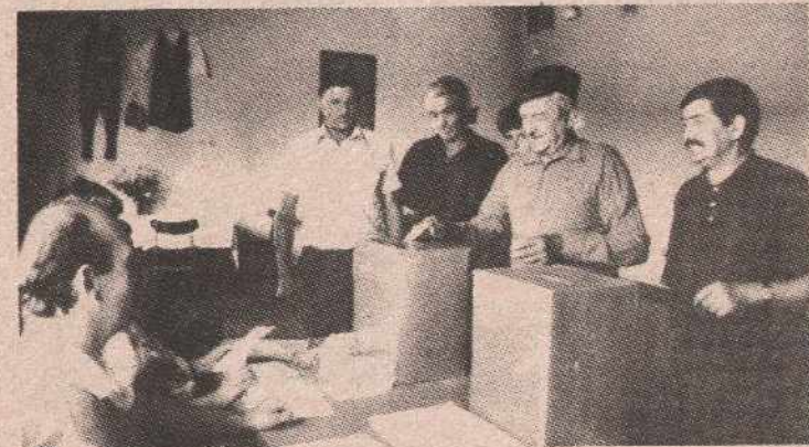
Гласање у Дебељацима