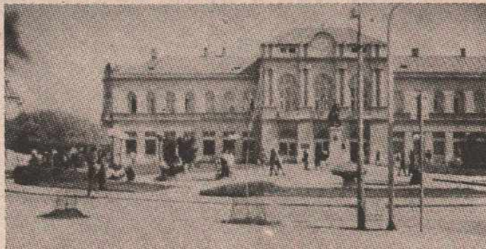
Из центра Бијељине

БИЈЕЉИНА. 27. августа - На изборно мјесто број 2 у Мјесној заједници Стари град у Бијељини до 11 часова на гласање је изашло око 20 одсто гласача. Да би се тај проценат већ у 11.30 попео на преко 30 одсто.