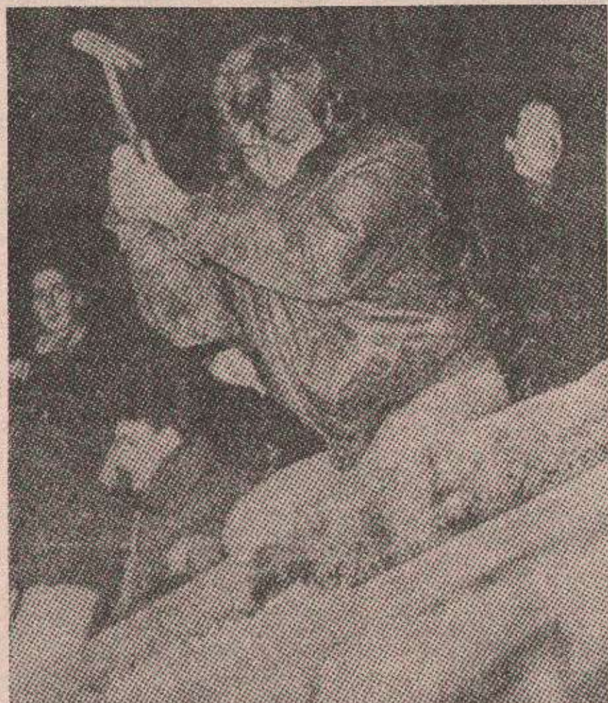
Почетак краја: Рушење берлинског зида

„Совјетскаја Русија“ оцењује да ће то бити „тренутак тријумфа Хелмута Кола и понижење не само Бориса Јељцина него и земље коју ће он представљати на последњој парадни руске војске у Берлину