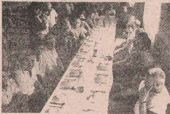
Млачани су срдечно дочекали пријатеље из Републике Српске