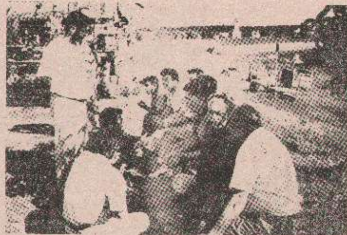
„Вукови“ у разговору са мјештанима