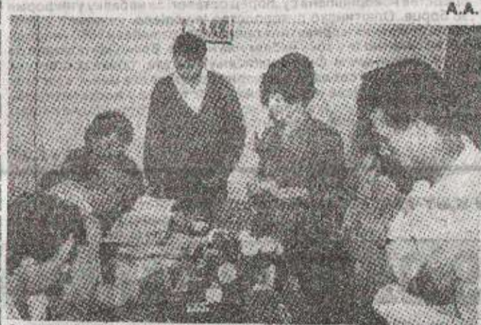
Стотину хиљада Бањолучана малена рекло - НЕ, са гласачког мјеста у МЗ Обилићеву