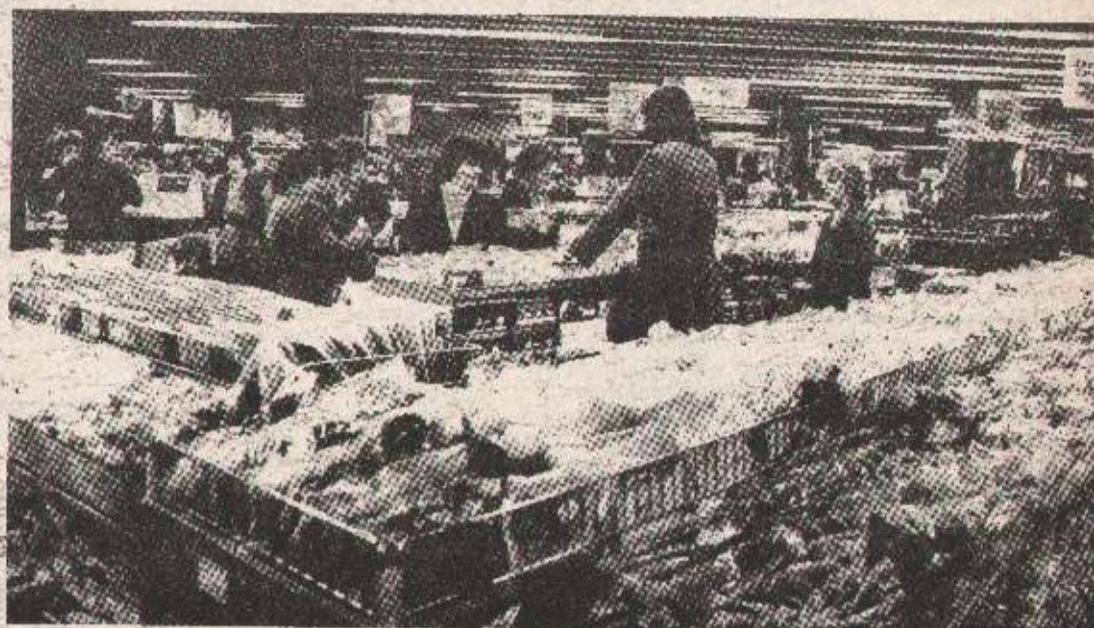
Робна кућа БОСКА (архивски снимак)

кад је коштало 1,12 динара. Остале цијене ду доживјеле мања „колебања“ навише.