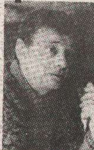
Боро ДРАШКОВИЋ: његов „Вуковар“ изван конкуренције

НОВИ САД, 31. августа (Танјуг) - Трећи фестивал југословенског играног филма „Новосадска Арена '94“, који ће се одржати од 6. до 11. септембра у Новом Саду, свечано ће отворити филм „Сеобе“ Александре Саше Петровића.