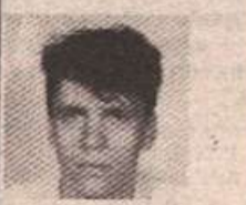
МЛАДЕНКУ Од мајке Пери 028563