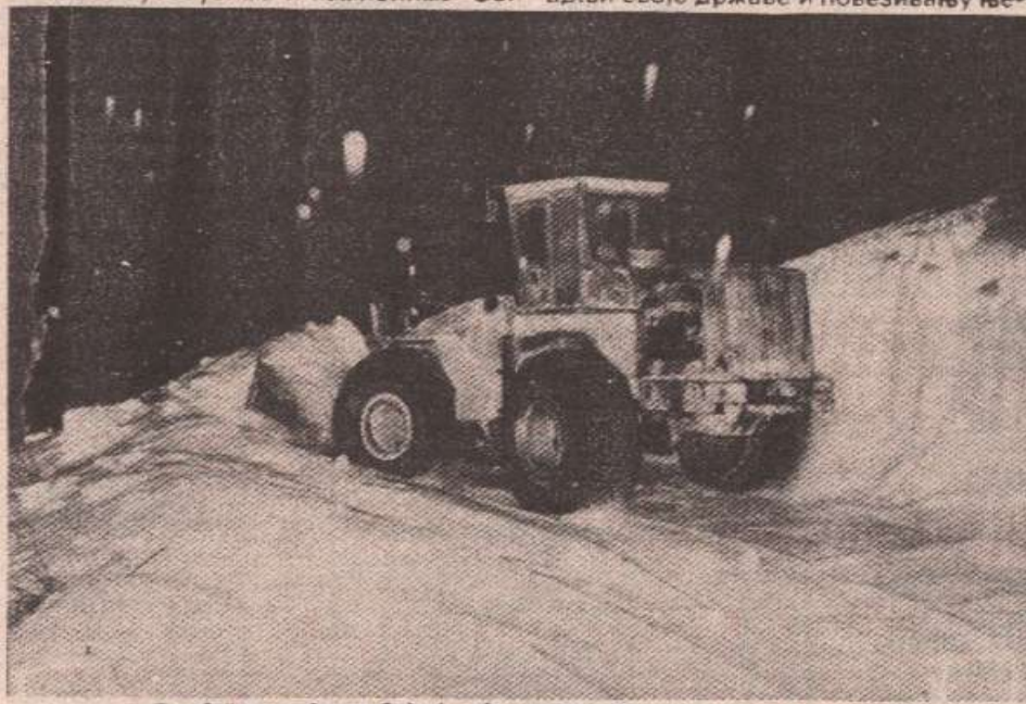
„Борба“ са снијегом биће још један изазов у предстојећој зими

војника и одређен број нових радника могли без тешкоћа наставити активности које ће морати одрађивати „Козарапутеви“. Јер путеви су путеви. Сви воде у будућност и историју — неизбрисиви су траг времена и људских напора