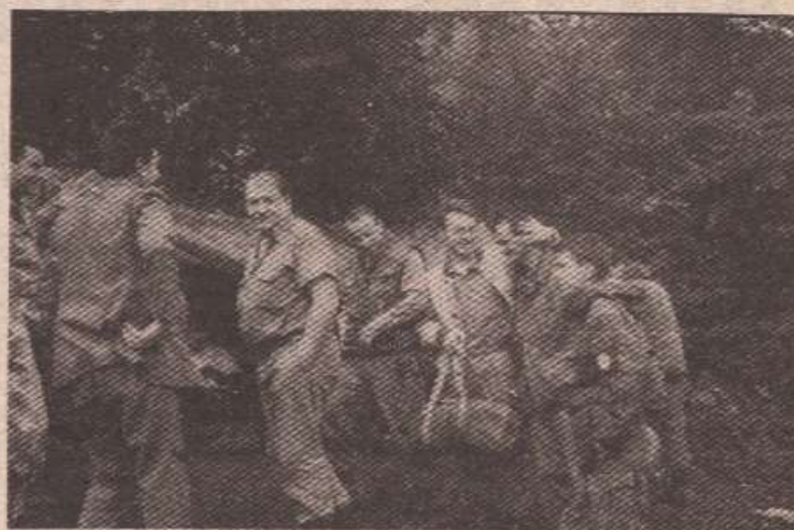
Кад смјена дође, прагаши се радују повратку међу колеге

И команданта, пуковника Лазаревића, на положајима које обилазимо дочекују пријатељски. Они из њега а он, каже, из њих црпе оптимизам и увјерење да ће се истрајати у борби и да ће се у