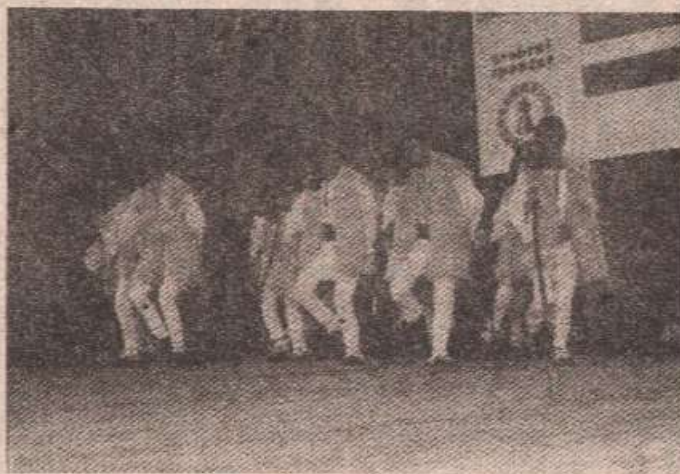
Мушке чобанске игре са Змијања

„Од када радим овај посао, ово је један од најбољих koncerata фолклора. Све је било изузетно квалитетно одрађено, и фолклор и оркестар, а посебно је стр-