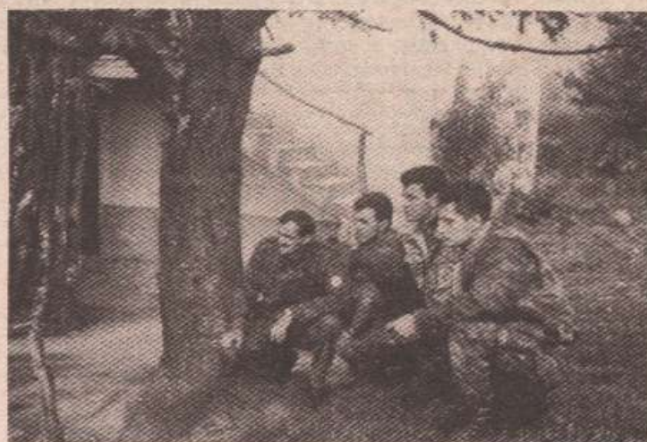
Балије су на пушкет и њихови положаји се виде голим оком