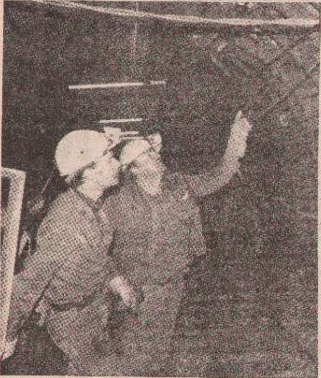
ИЗ РУДНИКА ЦЕРТИСАНА