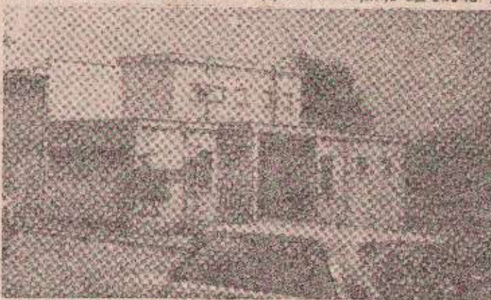
Бископ у Челинцу-Селу, заправо школа?

Поред овог друштва у овом граду никаданије ни постојало неко друго културно или умјетничко удружење.