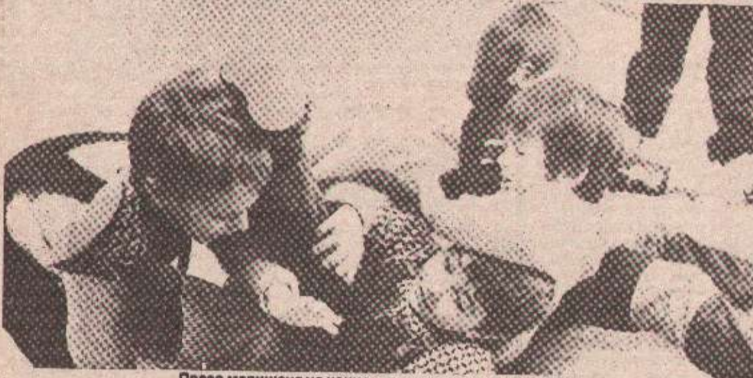
Право малишана на национални и културни идентитет

Једна од идеја у реформи предшколског васпитања и образовања која је у почетку стидљиво и узгред спомињана, данас све више заживљава у пракси. Ради се о Програму: Светковине и правци, нове духовне промјене у области предшколског васпитања и образовања. Завршетак овог сложеног и комплексног пројекта је прикрају. О каквом је Програму рјеч?