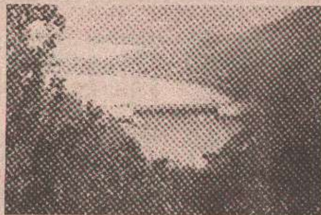
Заорничка брана на Дрини