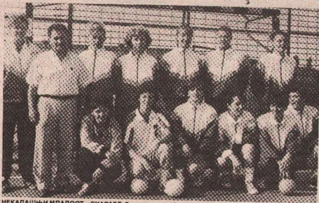
НЕКАДАШЊИ МЛАДОСТ—СКАРАБЕ: Рукометашнице РК Бања Лука