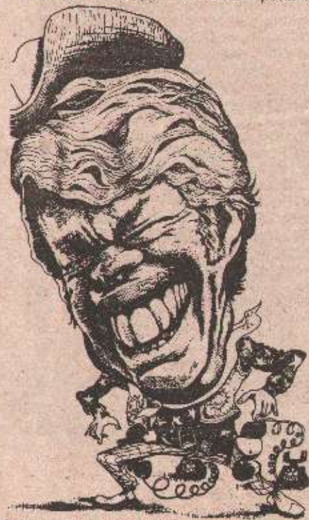
Клинтонова „добра вила“ Цими Картер на Пуријевој карикатури

супспендовање санкција против Хаитија“ - изјавила је прошле ноћи у Њујорку Медлин Олбрајт, амерички амбасадор у Уједињеним нацијама. По њеним ријечима, како наводи агенција АП, санк-