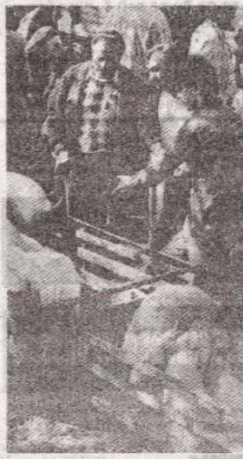
Свиње натраг са пијаце (архивски снимак)