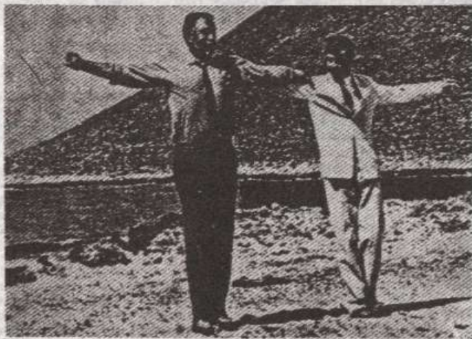
Са великог платна на позоришној дасци: Ентони Квин као Грк Зорба