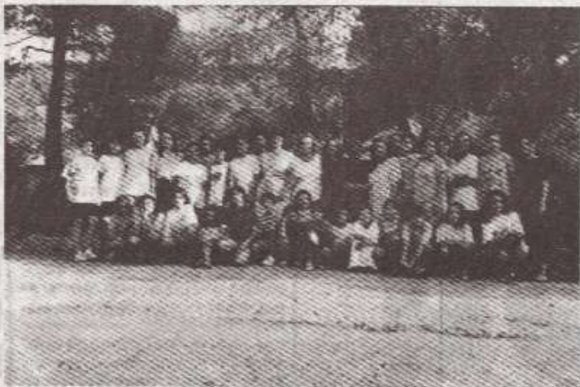
Љетовање у Грчкој остаће им у најлепшој успомени