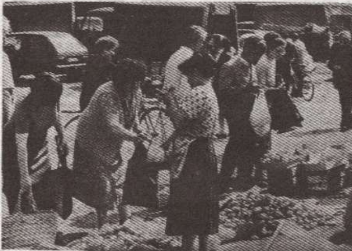
Кантар за сваки џеп — кромпир 30 пара

фа кошта 16 динара по килограму, а од цигарета „класик“, „партнер“, „век“, „морава“ и „ХФ“ се продају по цијени од 11 до 15 динара