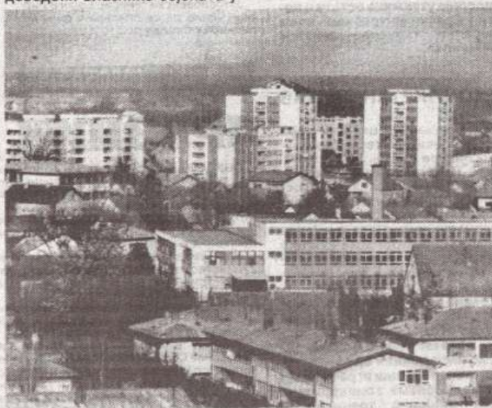
Бања Лука је одувијек привлачила својим љепотом. Захваљујући брзом развоју, као средиште овог дијела и највећи град Републике Српске, привлачи све више намјерника.

некретности путем куповине, продаје или замјене. У Бањој Луци је основано више таквих предузећа у приватном власништву, од којих многа, мора се нажалост констатовати, "лове у мутном", доводећи власнике објеката у