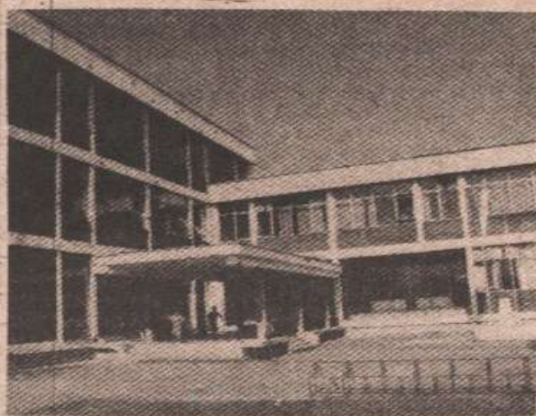
Средњошколски центар у Броду