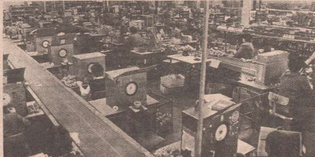
Десет људи на једно радно мјесто: Из производних погона „Чајвеза“ (архивски снимак)

бањолучке филијале Републичког завода за запошљавање.