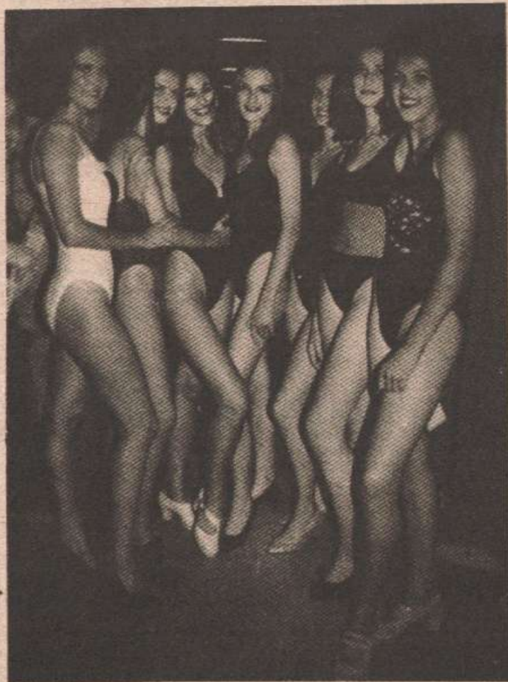
Најљепше на окупу (мис Посавине прва слијеза)