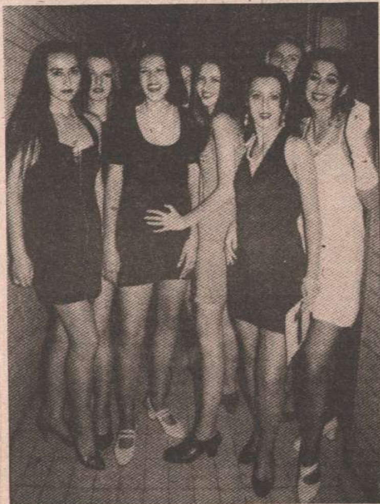
Љепотице спремне за промену

„Вруће“ је, међутим, постало онда када су мисице прошетале Спортским цен-