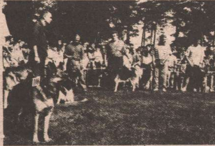
Највише је било њемачких овчара