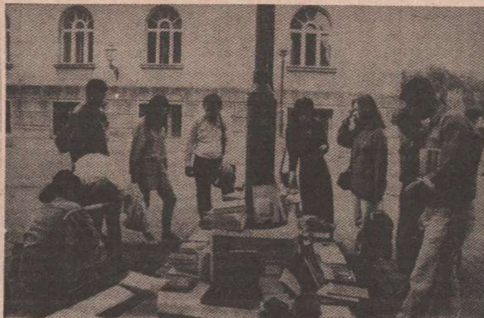
Улична књижара у Маслешиној