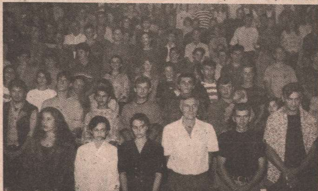
Почело је са „Боже презде“

Награде за најљепше дјевоке обезбиједило је Предузеће за производњу чарапа и предива „Босна-Брод“, један од најперспективнијих посавских колектива.