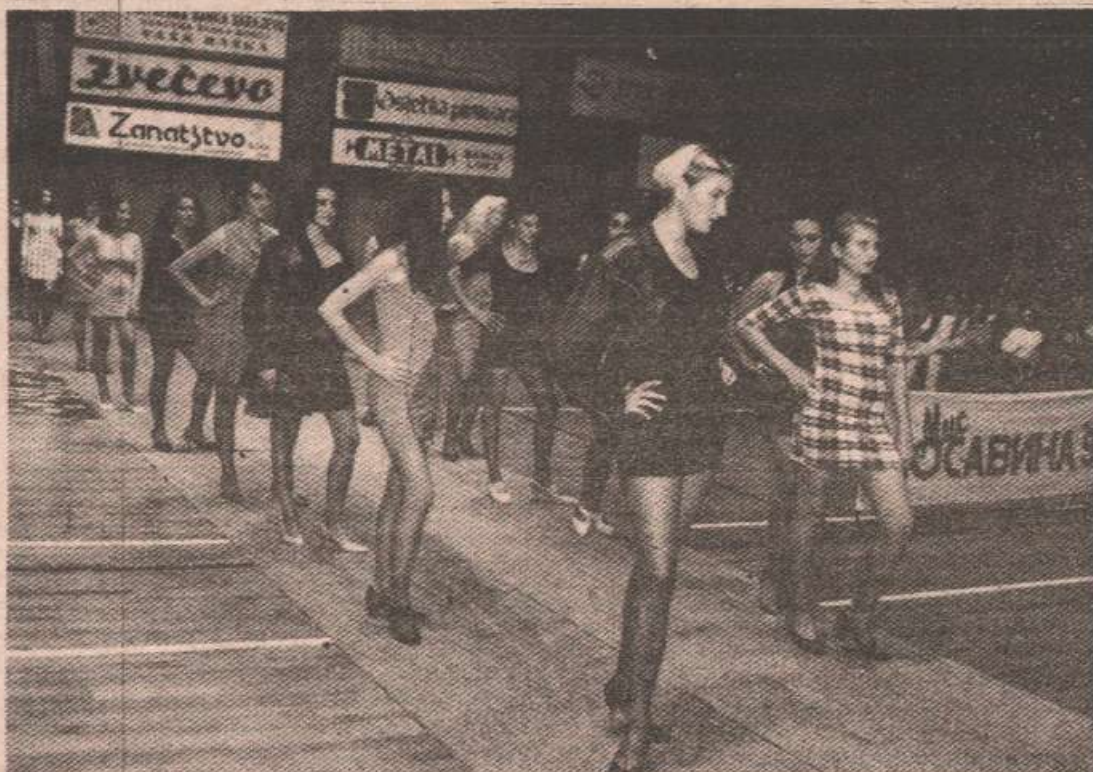
Тада је све још било неизвјесно

Програм је отворила балетна група предузећа „Marella CO“, а потом смо