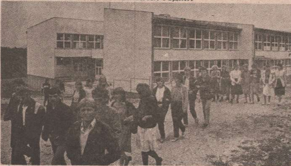
Средњошколски центар у Кнежеву