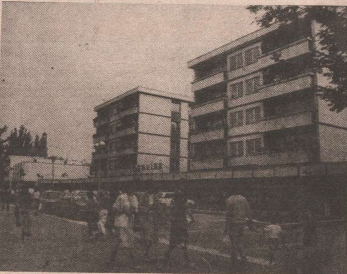
Главна улица у Српцу

Нешто боља ситуација је у Дому здравља, гдје се примарна здравствена заштита становништва задовољава са 90 посто. У овој дјелатности стање је боље и због тога што здравствени фондови боље функционишу, па се здравствени динар враћа, али и због пријемне партиципације услуга. У србачком