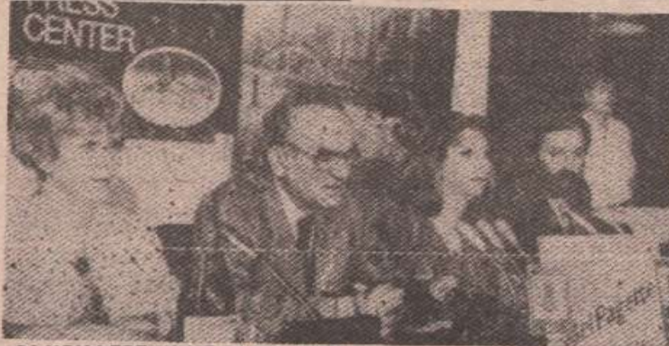
СА КОНФЕРЕНЦИЈЕ ЗА ШТАМПУ

Половину програма 26. БЕМУСА чиниће музичка дјела 20. вијека, а остали дио музика из других периода и премијере