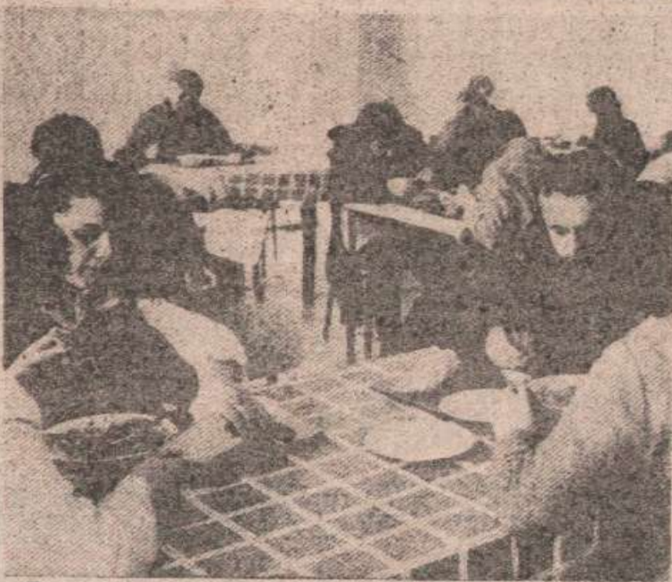
Дом и менаџмент основног студентског стандарда (архивски снимак)

У Студентском дому у Бањој Луци има мјеста за нешто више од 650 академских грађана. Капацитети дома одавно су попуњени и препуњени. Број илегалца је већи него икада, али због тренутне ситуације, томе се гледа кроз прсте. Студентски стандард је веома низак, тако да су и издашн везани за смјештај студената минимални. Смјештај у дому је 10 динара мјесечно. Организована је припрема једног obroка (ручак) у студентској менизи, чија је цијена динар. С обзиром да су субвенције за смјештај и исхрану укинуте и да студенти плаћају комерцијалну цијену за исхрану и смјештај, ове цијене су веома повисне. Већ дуже хигијенски услови у дому су очигитни, што је видљиво и случајном