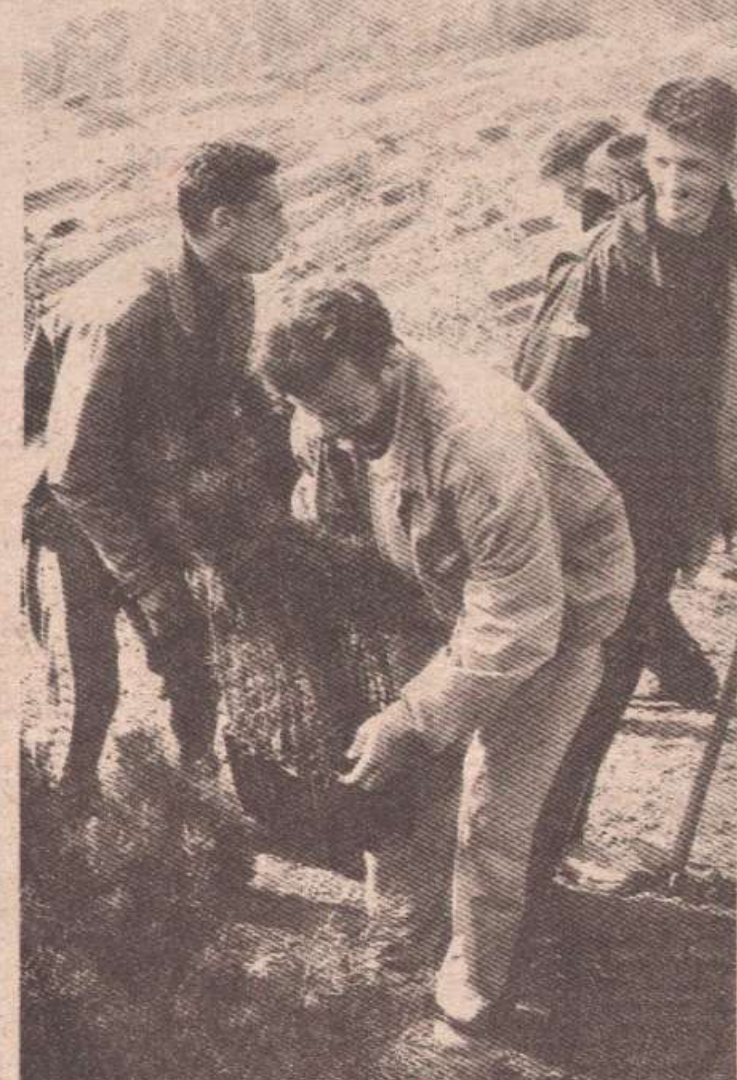
Саднице из Грахова на бањалучким плевнима

ПУКОВНИК ЛАЗО БАБИЋ, КОМАНДАНТ 18. КОРПУСА СВК