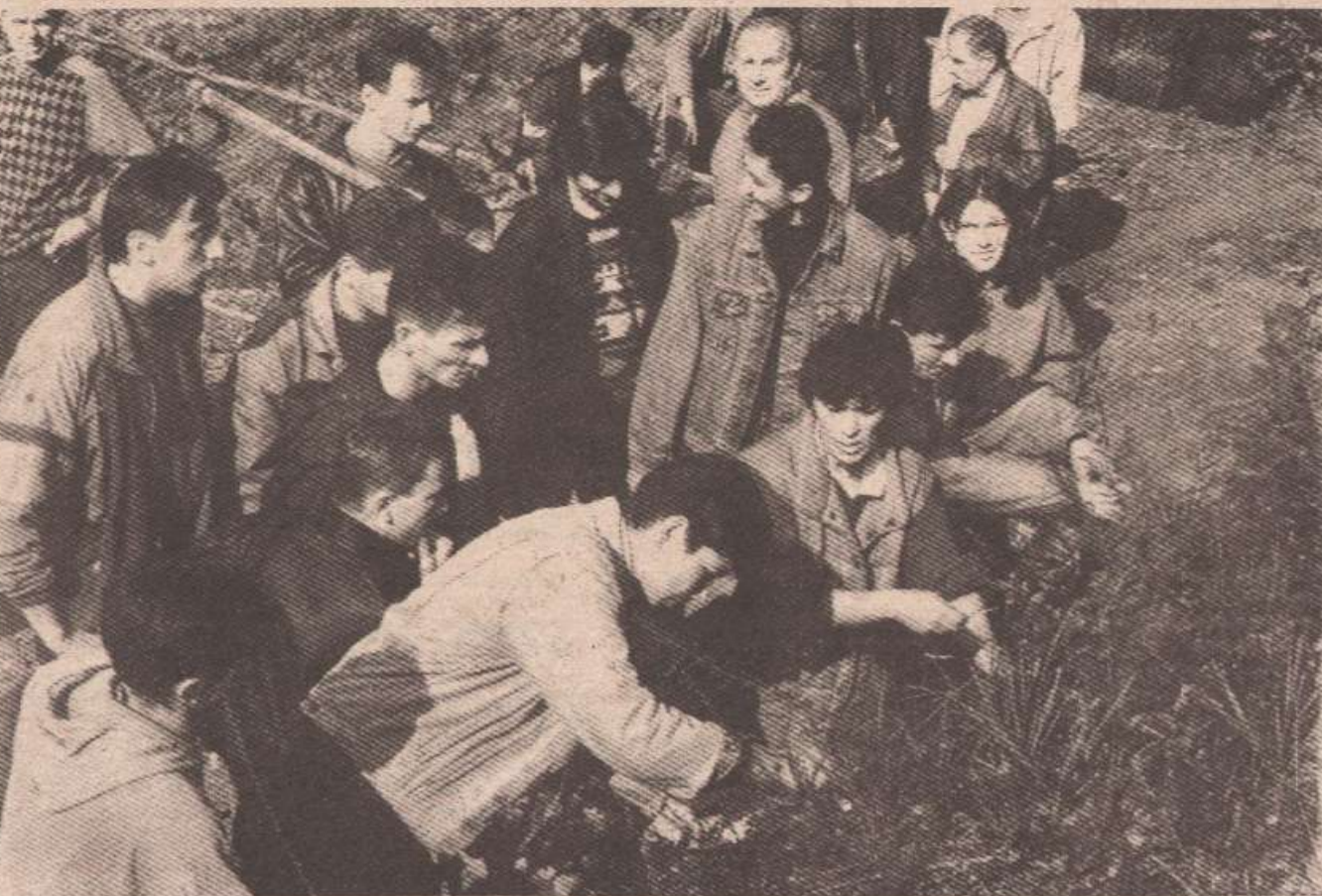
Студенти и професори заједно на пошумљавању