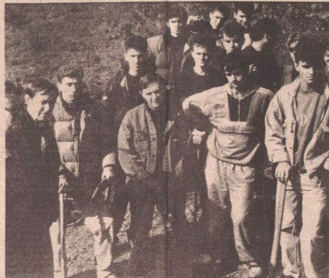
Кратке упуте прије почетка сађења

• Док су на једној страни сјечена дрва за породице погинулих бораца, на мјесту гдје је раније била шума — започињале су нови живот младе саднице