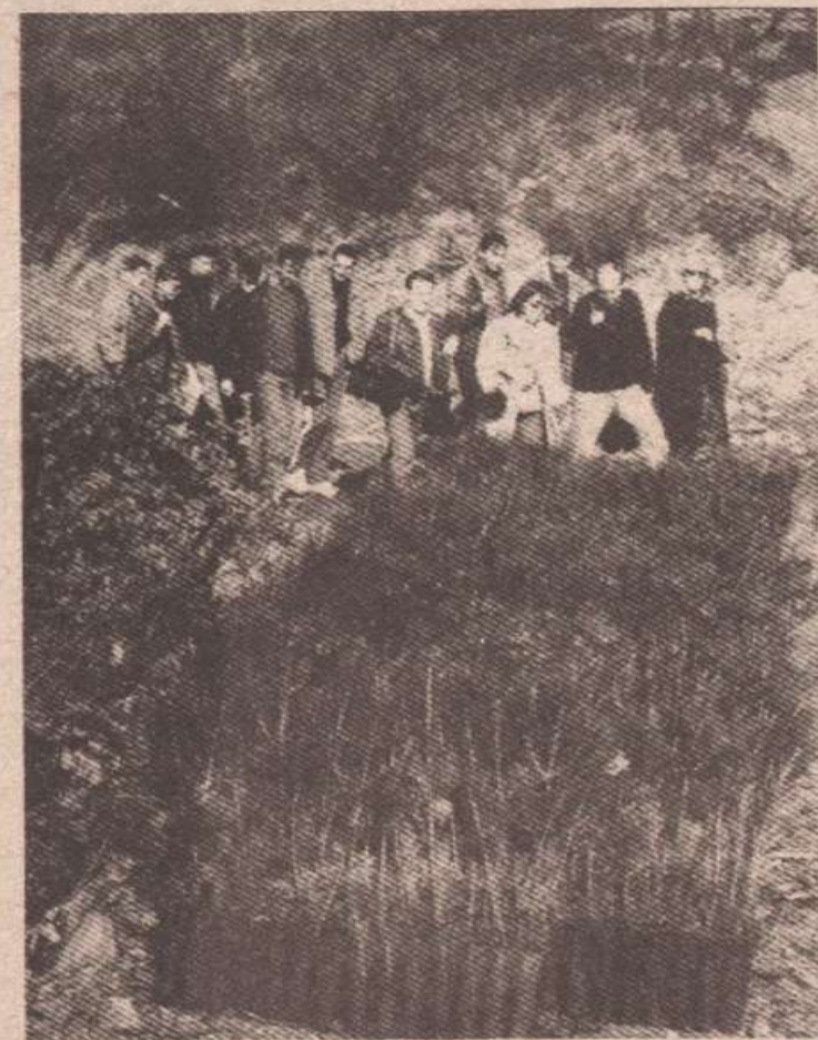
Саднице чекају студенте