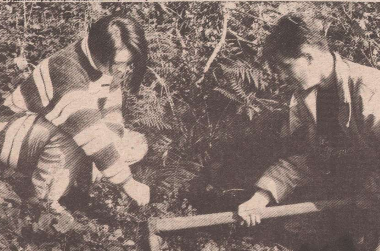
Студенти шумарства на дјелу