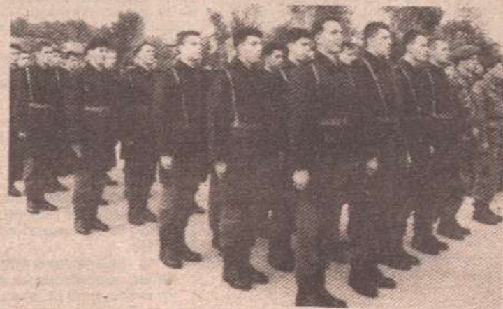
Достојанствени и поносни: Војници пред свечаним чин полагања заклетве