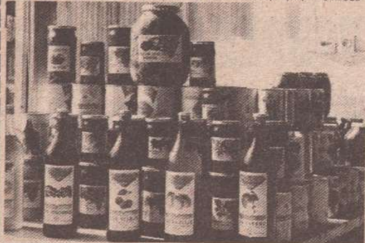
У пуном погону — детаљ са једне од производних линија

се пришло савременој преради неискрпних извора минерала и витамина. Убрзанијим развојем агро-комплекса и изласком до-