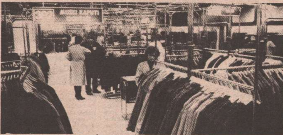
„Боска“ очекује зимску гардеробу (архивски снимак)

Јединствене цијене за конфекцију не постоје. Нарочито је тешко разликовати старе од нових модела, оне који су годинама