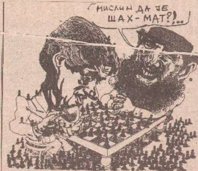
(Карикатура Тајмса, Њујорк)

Председник Клинтон је недавно поновио да не