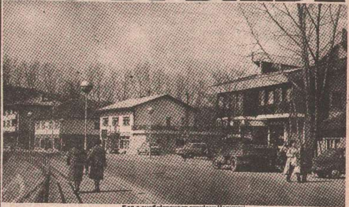
Бања снабдевеност струјом: Челинац

● Нови далековод обезбјеђује двоструко већи доток електричне енергије, стабилнији напон и мање кварова на електро-мрежи