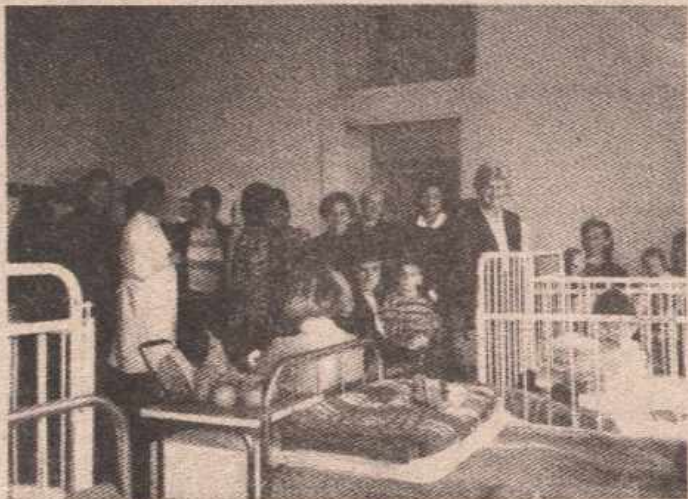
Посјете дјечијим установама такође у програму „Дуге“

мјесечно семинари и предавања, које ће држати стручњаци, а биће посвећени различитим актуелним темама из живота људи који имају било какве тегобе.