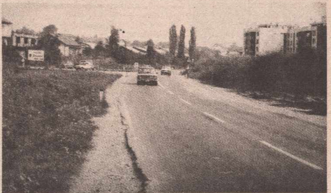
Необрађена земља чека баштоване