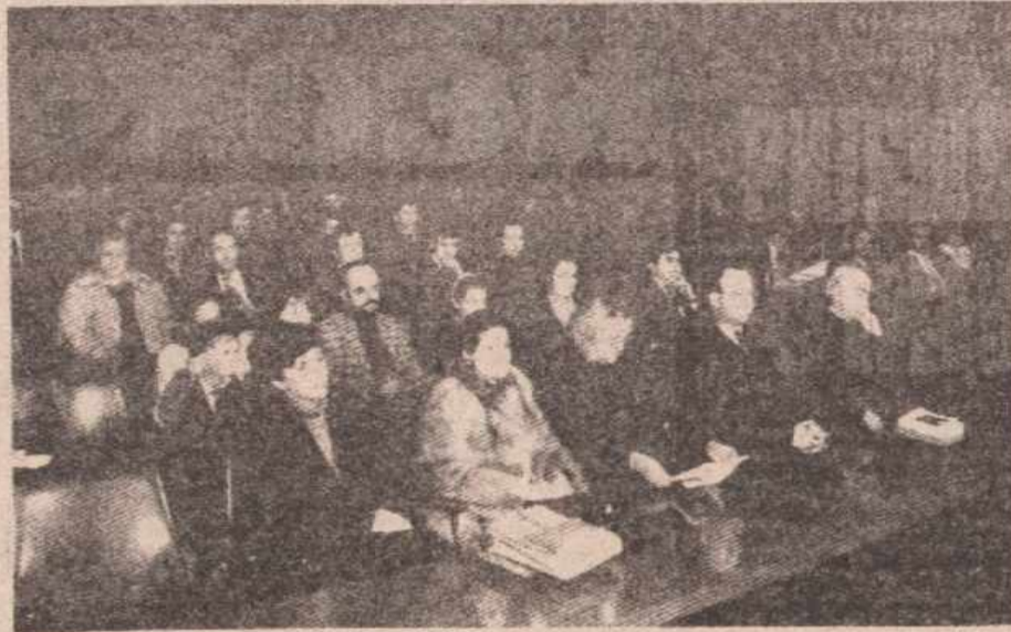
Изузетак културног догађаја у Бањој Луци

Тако биљежимо да је Српско просвјетно и културно друштво „Просвјета“ основано 31. августа 1902. године у Сарајеву. У свом, готово вијек дугом постојању „Просвјета“