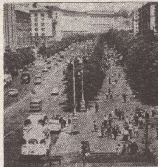
Кијев: Велике количине отрова

ријечи реализацију овог штетног посла. Али у то вријеме моћни Зјагилски ни успио, уз помоћ државне комисије за хемију, да прогнур регистрацију „Монсантовог“ препарата званог „харнес“ у Украјину.