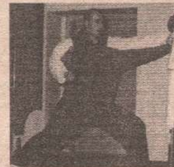
Залагање на првом мјесту

пењање степеницама успјеха грубо прекида рат 1992. Пријављује се као извијач добровољаца и са својим