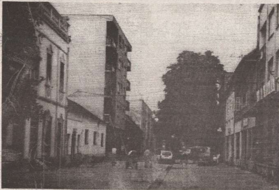
Све боља сарадња ветеринара: Шамец