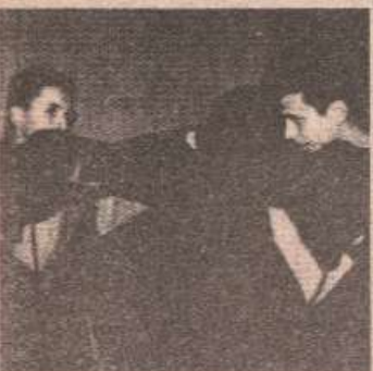
КОВАЧНИЦА ДРАГУЉА: У клупским просторјама често се намећу боксери Славине између себе