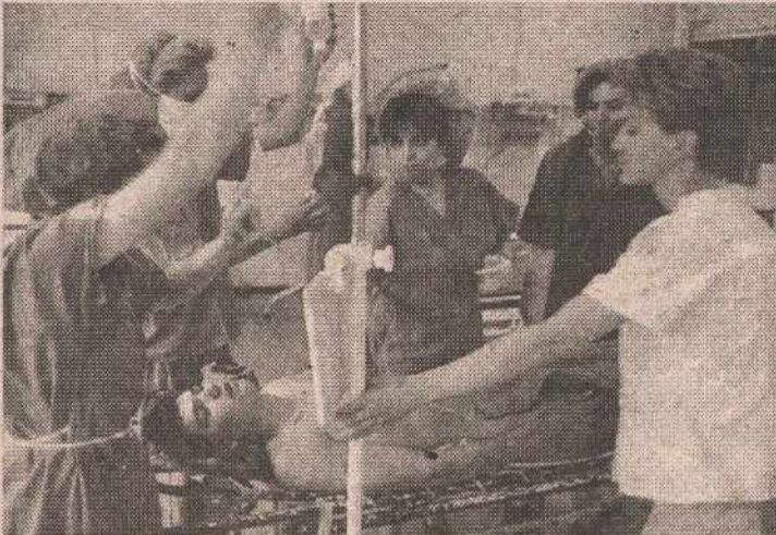
Збрињавање повријеђеног борца код Кључа (архивски снимак)

Конгрес ће имати веома богат програм. Предвиђена је обрада и размјена искустава у оквиру четири основне теме и великог броја подтема: Здравствене