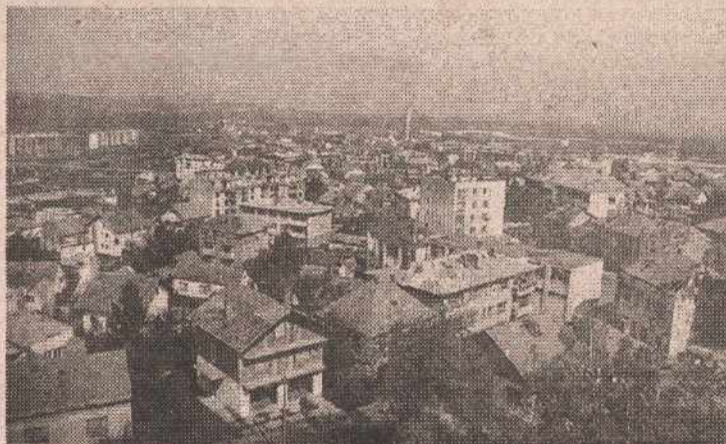
Град који носи видљиве оžilјеке рата: Дервента