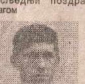
ЉУБИ Од бабе Јелка Црногађе 029858