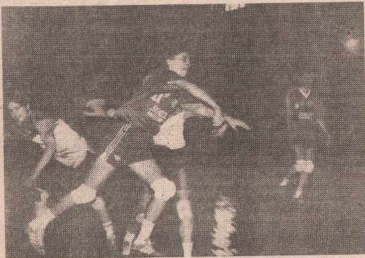
Рукометашице Боксита: успјешно на два колосијека

МИЛИЋИ - Ближи се крај јесење прволигашке трке у женској конкуренцији, у групи Исток. Вриједно је напоменути да су екипе Боксит из Милића и "10. мај" из Хаџића, одскочиле својим квалитетом, што се може видјети и на табели. Боксит је неприкосновен с 15 бодова из осам сусрета док екипа из Хаџића заостаје за водећим само два бода. Треба истакнути да је у првом дијелу првенства у судару двију водећих екипа било мирољубиво пошто су бодови подијељени. Био је то једини "кикс" државног првака.