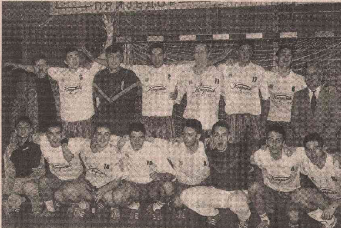
ПОБЈЕДНИЦИ КУПА РЕПУБЛИКЕ СРПСКЕ: Екипа Борац Крајс