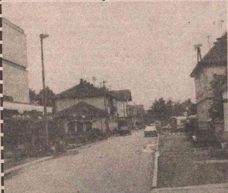
Улица у Шамцу