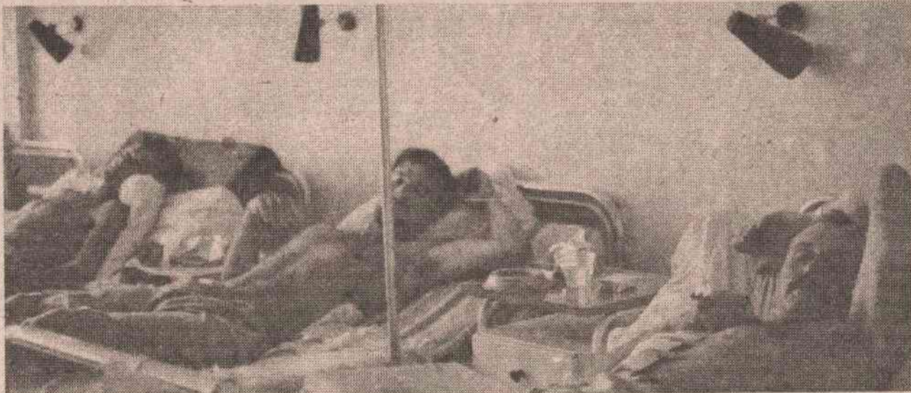
Свака посјета борцима на лијечењу уноси нови оптимизам и казује да нису заборављени

проблема има и да је крајње вријеме да се они почну систематски рјешавати.