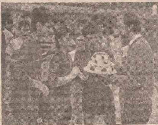
Награде најмлађима на једном од ранијих турнира

Наиме, током зимског распуста играли би се мечеви у категоријама пионирка, кадета и јуниора. Подразумијена се да ће имати исти третман као и сениори, и што се обавезујућа награда тиче, а и медијске пажње.