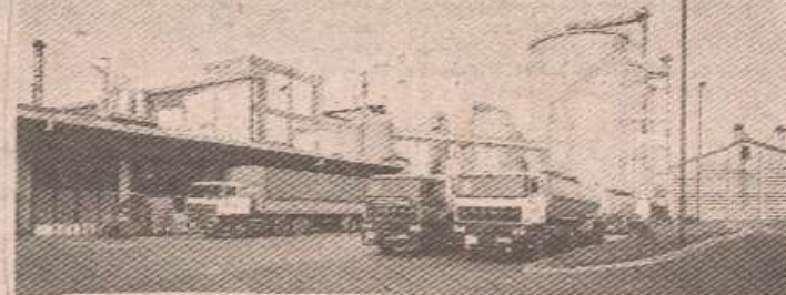
Технологија за двадесет и први вијек - ХПК Драксенић

"Сорбитол" је тада, а и данас је један од главних узданица и роба Фабрике за хемијску прераду кукуруза у Драксенићу, гдје се једино и производи на подручју свих српских земаља. "Алфа-лавал" се у међувремену није коректно понијела: од 54,5 милиона ДМ обавеза, Швеђи су само симболично извршили уговоре клаузуле, да би, запослени у ХПК, примајући минималне личне дохотке сами отплатили инвестицију, што је у тадашњем времену благостања и солидних примања у другим предузећима, овом капацитету давало епитет промашеног и од друштва потпуно напуштеног. Међутим, мало је ко обраћао пажњу на нове производе из Драксенића и знатно већи квалитет од прописаног од стране инопартнера, што је заинтересовало домаћу фармацеутско-козметичку индустрију која је све више захтијевала пословно партнерство. Послије таквог успеха властитим је средствима и на бази властитог пројекта, изграђена фабрика за производњу кристалног сорбитола, што је био сан свих запослених. Круг се пословних партнера нагло почео повећавати широм Европе и свијета, тако да је пред само почетак рата, била