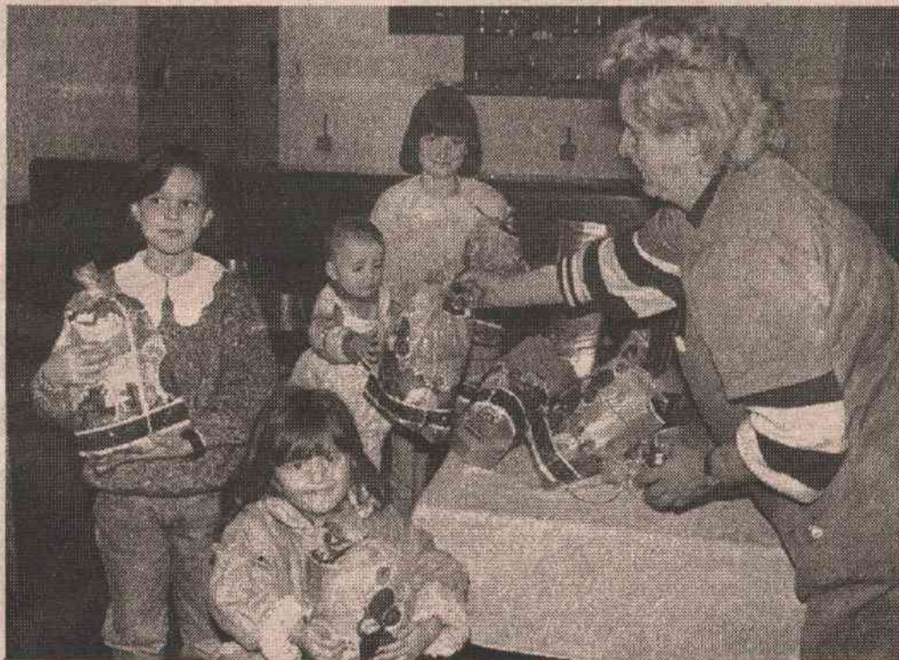
Са додјеле поклон-пакетића у фабрици обуће "Босна"