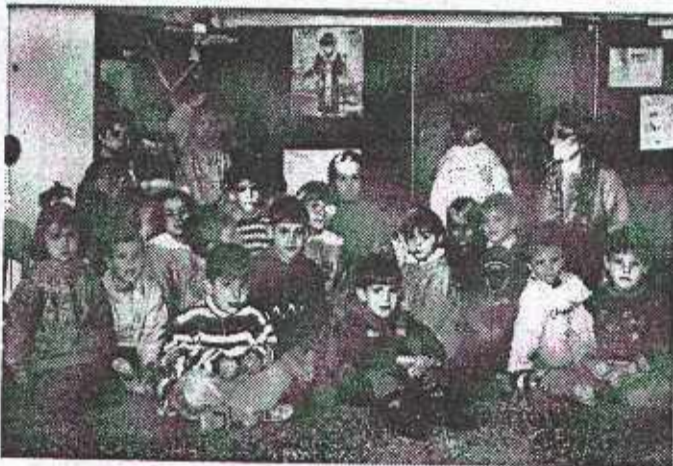
Малишанима из Вртића "Мара Митров"