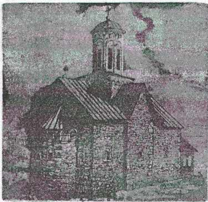
Манастир Липље, графика Михаила Раките

БАЊА ЛУКА, 19. децембра - Као и сваке године, Јавно предузеће "Глас српски" штампало је пригодне календаре за предстојећу годину.