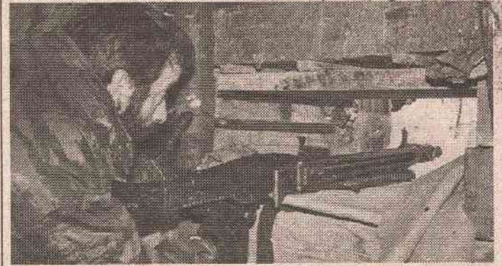
Нека знају они с друге стране цијеви: српски војник никад не одступа

Српска војска је показала и доказала да зна да се бори и да своје не да.