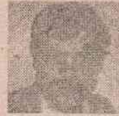
МИЛАНА (Тасле) БОРОЈЕВИЋА