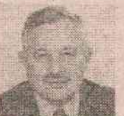
БУРО С. КУЖЕТ

Јављамо тужну вијест да је наш драги син, отац и дјед