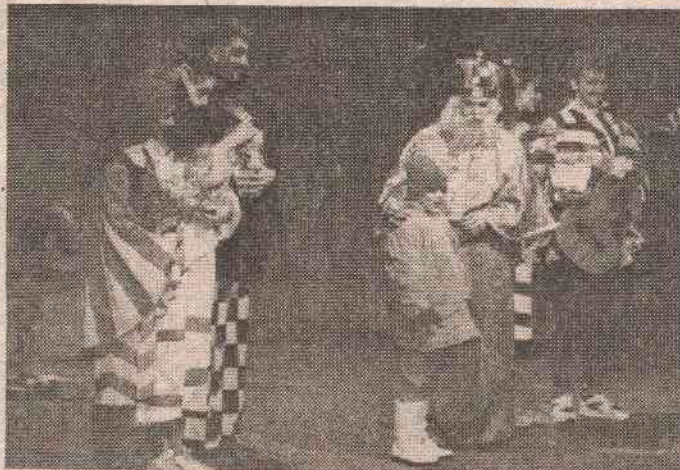
УЗ "ЧАРОВНУ ЧЕСМУ" И ПАКЕТИ