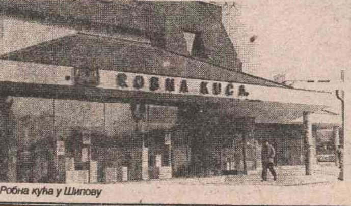
Робна кућа у Шипову